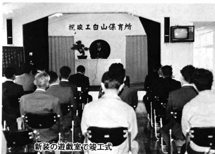
新装の遊戯室で竣工式