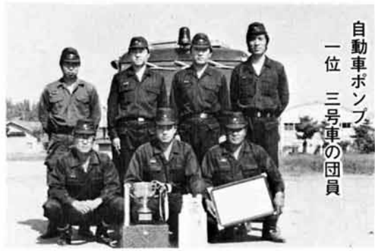
自動車ポンプ 一位 三号車の団員