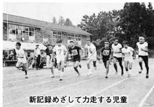
新記録めざして力走する児童

参加校 越路小学校 (五・六年生) 岩塚小学校 ( ) 東谷小学校 ( ) 塚山小学校 ( )