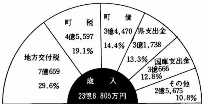
昭和53年度一般会計決算額 (単位: 万円)

歳入総額は、二十三億八千八百五十三千円、前年度と比較し、六億六千六百六十六千円（二十八・三パーセント）と大幅な増加を示しています。