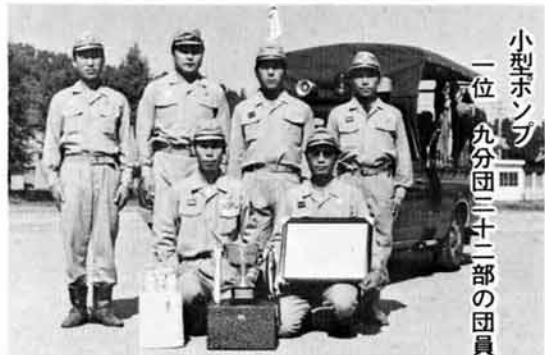
小型ポンプ 一位 九分団(二十部)の団員

旧軍人としての実在職年が三年以上ある方には、現在一時恩給もしくは一時金が支給されていますが、まだ請求されていない方が相当あります。未請求者又は遺族の方は、次の事項を参考に、県庁民生部援護課又は町役場福祉課へおたずねください。