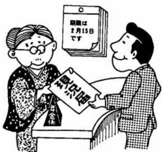
忘れると年金のストップも...

一、特別弔慰金(三万円の国債)を受給した人。なお、受給した人が死亡した場合はその他の遺族(子又は兄弟姉妹)に支給さ