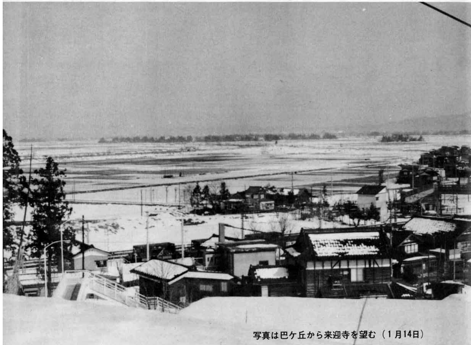
写真は巴ヶ丘から来迎寺を望む (1月14日)

■ 発行 / 越路町役場 (新潟県三島郡越路町) TEL (02589) 2-3111 ■ 印刷 / 大川印刷株式会社