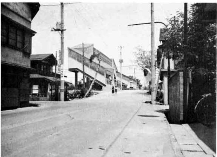
△県道長岡片貝小千谷線は昨年国鉄信越線との立体交差が完成し、ながい間利用してきた与板街道踏切(通称土佐屋前踏切)が閉鎖となりました。これに変わりこんど新しく人が通るこ線橋が架けられました。