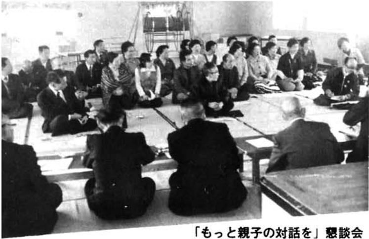
「もっと親子の対話を」懇談会

町青少年問題協議会では、去る三月十二日(日)塚山保育所において、青少年健全育成懇談会を開催し、集った青少年の保護者の熱心な協議懇談が行われました。当日の助言者には、長岡警察署をはじめ長岡大手高等学校校長等学校側から四名のご出席をいただき適切な御指導のもとで大変有意義であった。以下当日の様子を中心に青少年健全育成についてお知らせいたします。