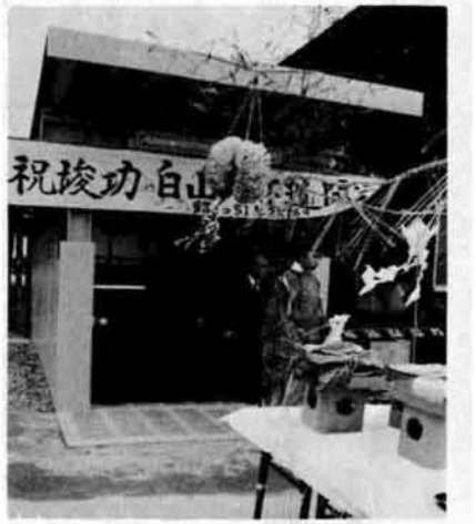
完成した白山地下道

去る二月二十八日、来迎寺駅裏の白山団地と駅前を結ぶ白山地下道の完工式が行われました。