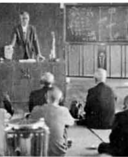
四十九年度の教室