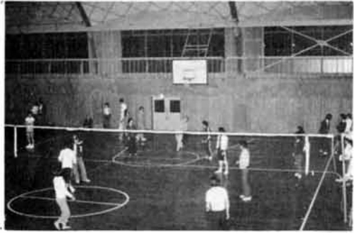
学校開放でバレーボールをする若者たち