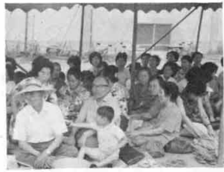
▷孫をつれてせがれの操法……