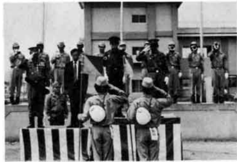
◁書き渡ったラッパの音