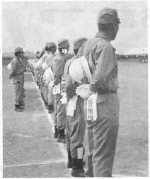
△火の用心の手ぬぐいを腰に下げて参加する団員