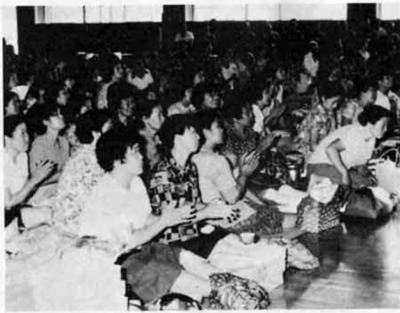
△歌や踊りに拍手をおくる家族

七月二十八日の日曜、炎天下のもとで町消防演習が行われ、消防演習が行われ、また、今年には自治体消防設立二十五周年を記念して、団員の家族を招き日頃の労をねぎらう家族慰安会も行われました。演習では、家族の見学もあってポンプ操法、小隊訓練に力が入り、また、今年には自治体消防設立二十五周年を記念して、団員の家族を招き日頃の労をねぎらう家族慰安会も行われました。