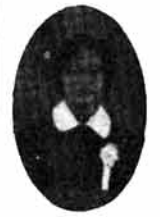
意見をのべる中学生

続いて、振興大会ではここ数年問題になっている自然破壊に対する認識を深めるため「緑と花でつもう町や村」というテーマを掲げ、参加した地元の高齢者クラブ、中学校生徒、婦人会の代表者が緑化への決意を述べ盛大な拍手を浴びた。