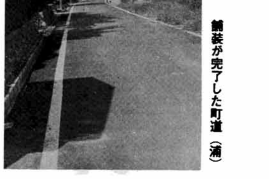
舗装が完了した町道(浦)

今年の町道の改良工事、舗装工事は降雪期前に急ピッチで進められております。 これらの事業は春以来、町道整備計画に基づいて関係各位のご協力により、進捗いたしました。 改良工事は今年度、約三、一〇〇米の全体計画のもと「西野、泉島線」の国庫の助成事業を始めその他町費を以って着手し約八〇%の二、四〇〇米が既に完了し残工事を施工中です。 この結果、町道の規格改良延長は八三、二〇〇米になり町道の三%が改良されることとなります。