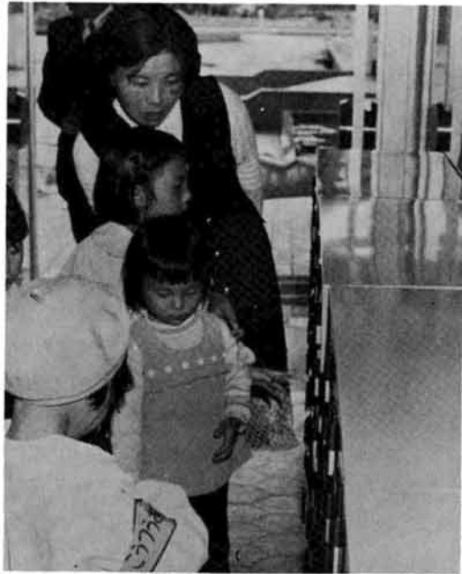
親子をさがす箱をげた

幼児教育が強く要望されている今日、公立保育園の設置によって地域の幼児教育、ひいては将来の社会をなう子どもたちを健全なからだと精神を育てあげることが目的として建てられたもので、塚山、来迎寺につぐ三番目の常設認可保育園です。昭和四十九年度は飯塚に建設する予定で、すでに用