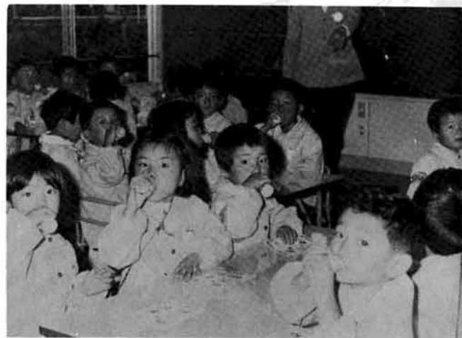
お祝にいただいたヤクルトを飲む

町立浦保育園を閉所 十月一日は浦保育園の開所式が行なわれた。この保育所は児童福祉法に基づく町立の保育所である。