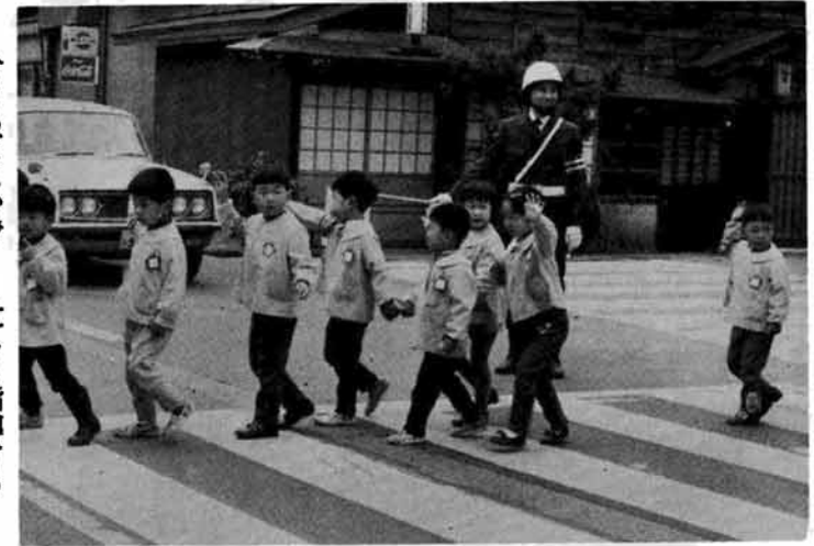
今日もどこかで……忙しく指導する

交通指導員が活躍しているにもかかわらず、事故はふえる一方です。指導員が活躍しているにもかかわらず、事故はふえる一方です。指導員が活躍しているにもかかわらず、事故はふえる一方です。