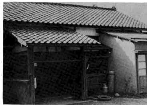
魔虚となった 来迎寺保育園

幼児教育が強く要望されている今日、公立保育園の設置によって地域の幼児教育、ひいては将来の社会をなう子どもたちを健全なからだと精神を育てあげることが目的として建てられたもので、塚山、来迎寺につぐ三番目の常設認可保育園です。昭和四十九年度は飯塚に建設する予定で、すでに用