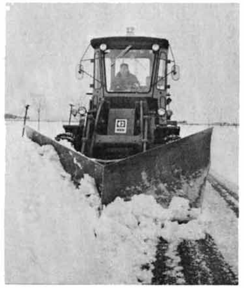
除雪ステーションを設置 幹線道路を確保

本格的な積雪期を迎え町では去る十二月四日、県土木部の除雪計画をもとに除雪対策協議会を開き今冬の除雪計画を決定し実施しております。 今年長岡土木事務所では町内に二ヶ所の除雪ステーションを配置