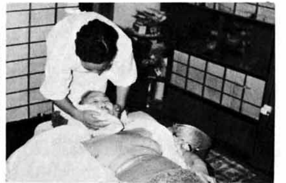
活動続ける奉仕員

長いあいだ待ち望んでいた児童手当制度が一月一日より発足し、日本の将来をになう児童が心身ともにすこやかに成長することは、国民すべての願いであり、家庭と社会がともに児童の健全な育成に努めることが望まれています。 この制度は、事業主と国、県、町とが費用を持ちあい、三人以上の児童を養育する人に児童手当(一人月三千円)を支給することに よって、家庭生活の安定と次代の社会をになう児童の健全育成、資質向上をはかることを目的として 越路町での受給者は次のとおりです。 受給者数 百四十六人 (公務員・公共企業体職員は除く) 六ヶ月支給額百二十三万六千円