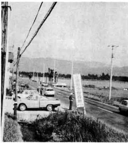
開かれた交通安全指導所

つける中、ドライバーからは、「ニコリ笑いながら「くろくろく」と返えされ走り去る車を見て、忙がしきも、皆さまふつとび、安全運転を呼びかける交通安全指導員の一日でした。