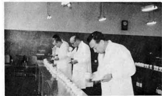
今年のできぐわいは?