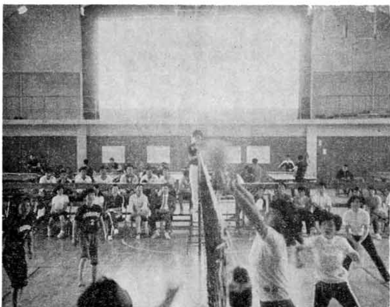
きれいなトスからスパイクきまる

。駆除—ゴキブリの通路に殺虫力の強い、しかも残効性の大きいスミチオン、ダイアジノンなどの油剤か乳剤を散布するか、又はハケを用いて塗るのが最も効果的であります。消化器系の伝染病や小児マヒなどの病原体を運ぶゴキブリ退治には食器や残飯などの後始末をよくし餌を与えないことと、ゴキブリの隠れ場所となるような所をなくすことに心がけましょう。