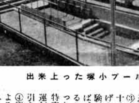
出来上がった塚小プール

塚小プール完成 去る八月二十二日、塚小プールの完成式が行われた。これは、町民の憩いの場として、大変喜ばれている。 プールの完成により、夏場の暑い時期には、多くの町民がプールを楽しむことができるようになる。また、プールの完成により、町の景観もより美しくなる見込みである。