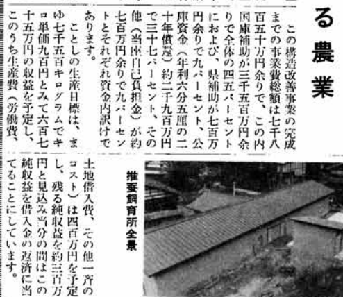
養蚕飼育所全貌 (左) 養蚕飼育所内 (右)

コストダウンおよび近代化など多くの目的をもつて昭和四十年から始められた養蚕を主とした不動産地区農業構造改善事業は、このたびにようやく完成した。 昭和四十二年四月二十一日にわたって、養蚕飼育所(二階建て)の建設が完了し、八月二十四日に正式に完成した。 この飼育所は、養蚕の生産性を向上させるために、最新の設備を備え、飼育環境を制御できるように設計されている。