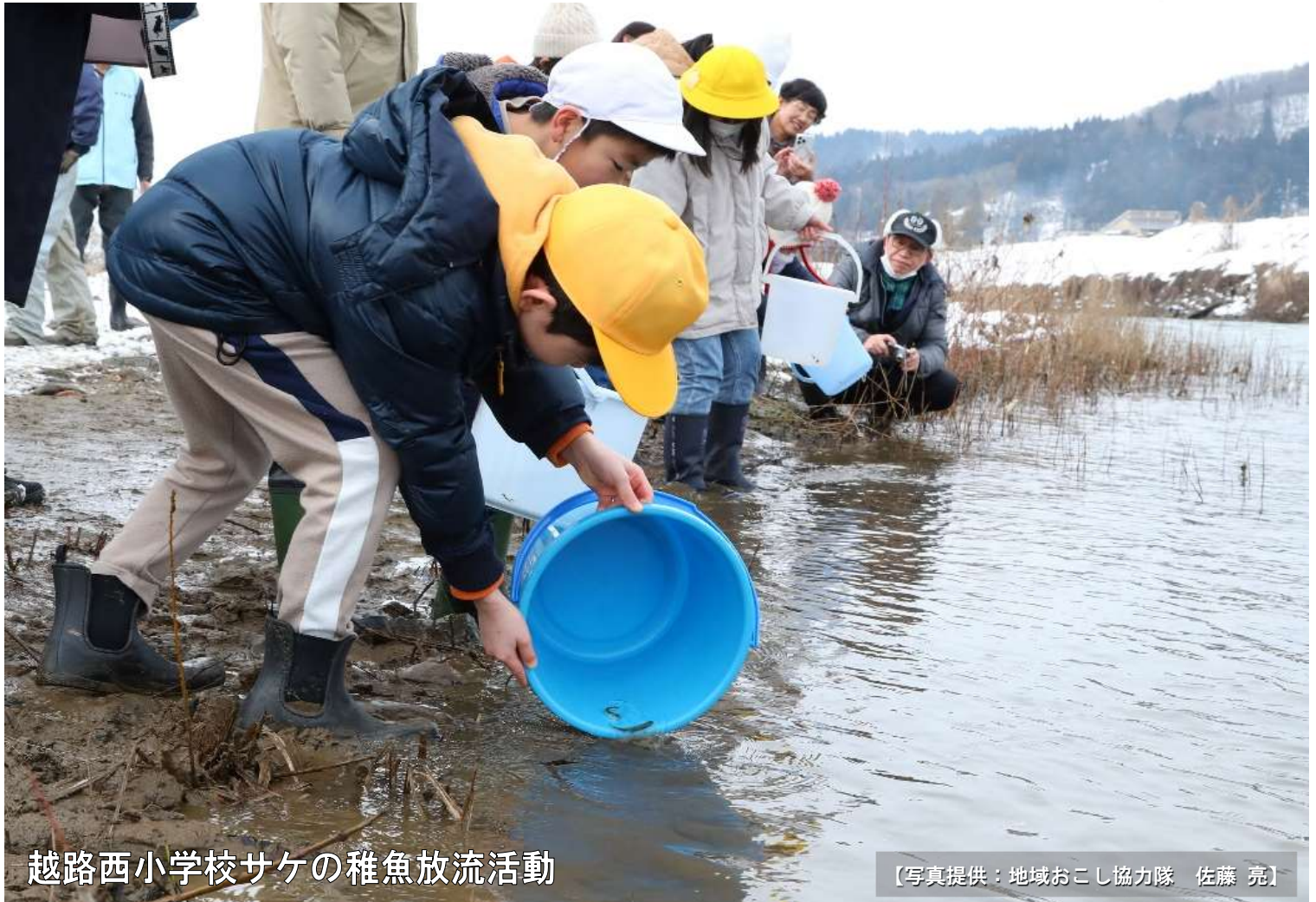
越路西小学校サケの稚魚放流活動