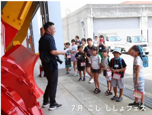
7月 こしししょフェス