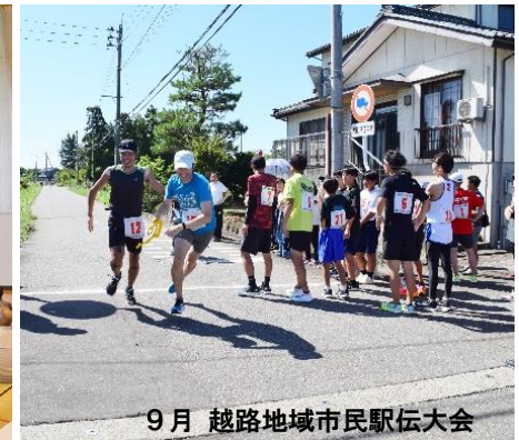
9月 越路地域市民駅伝大会