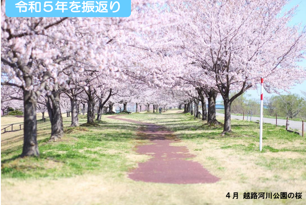
4月 越路河川公園の桜