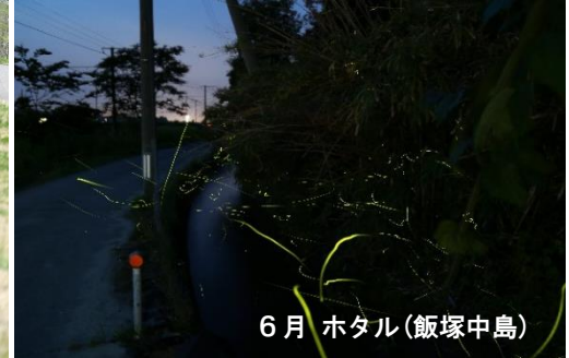
6月 ホタル(飯塚中島)