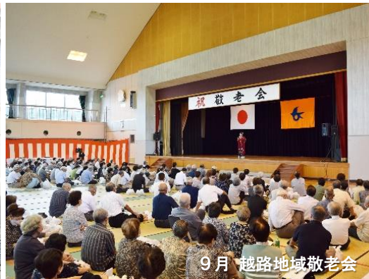
9月 越路地域敬老会