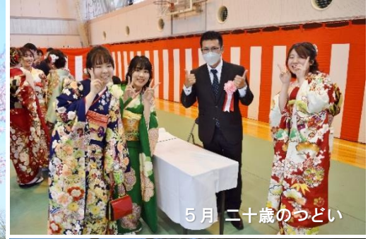
5月 二十歳のつどい