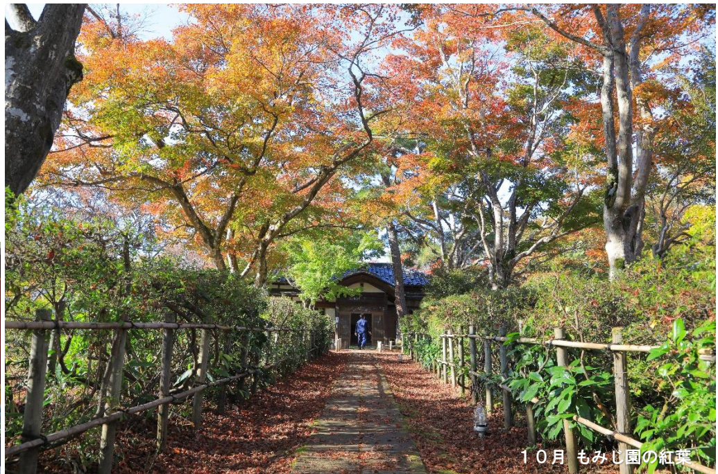
10月 もみじ園の紅葉