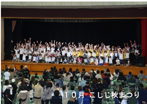
10月 こしじ秋まつり