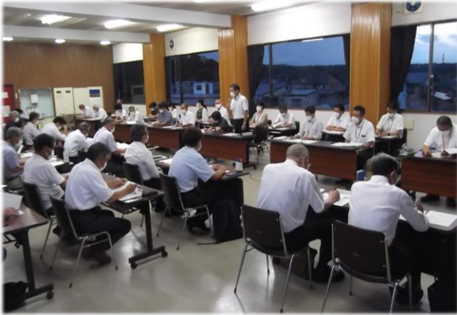
7月13日開催 第3回地域委員会分科会の様子