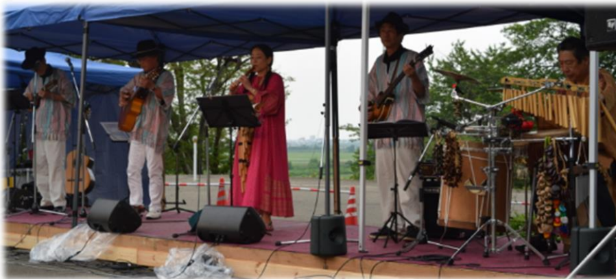
SABORES「サボーレス」 (6月の出演の様子)