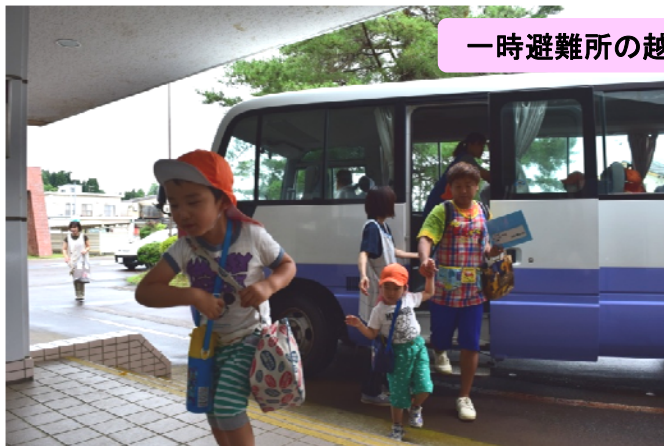
一時避難所の越路保健センターへ到着