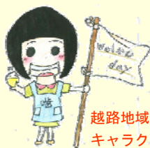
越路地域健康づくりマスコット キャラクターかむちゃん