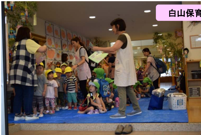
白山保育園からバスで移動