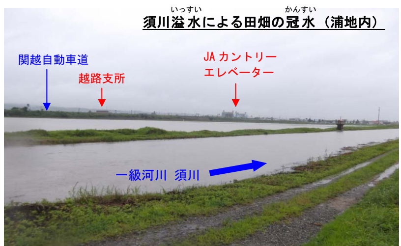
いつすい かんすい 須川溢水による田畑の冠水（浦地内）