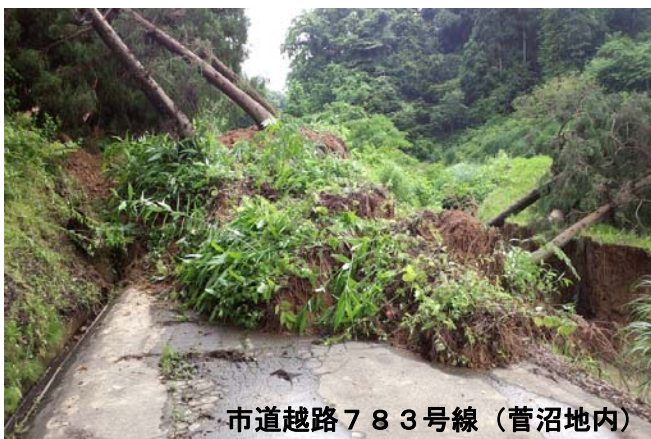
市道越路783号線（菅沼地内）