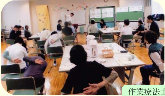
作業療法士の指導による体操です

毎月2回、体操や季節の行事、小旅行、茶話会などを通して、からだところの機能回復を図っています。 看護師やボランティアがお手伝いしますので、安心して参加いただけます。