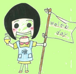
マスコット キャラクター かむちゃん