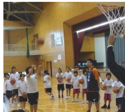
の小学生が参加し、現役選手の指導を真剣に受けていました。越路地域内外より48名

長岡市老人クラブ越路東部地区のスポーツ大会が開催されました。競技している人は真剣ですが、次々に起こるハプニングに客席は笑いが止まりません。中には笑いすぎて泣いている人も。越路の元気を改めて見せていただいた1日でした。(6月30日浦体育館)