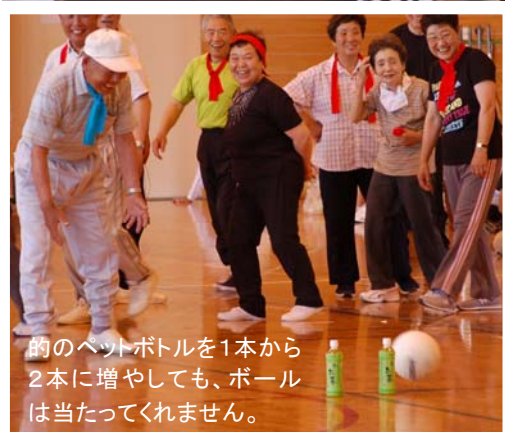
的のベッポトルを1本から2本に増やしても、ボールは当たってくれません。

長岡市老人クラブ越路東部地区のスポーツ大会が開催されました。競技している人は真剣ですが、次々に起こるハプニングに客席は笑いが止まりません。中には笑いすぎて泣いている人も。越路の元気を改めて見せていただいた1日でした。(6月30日浦体育館)