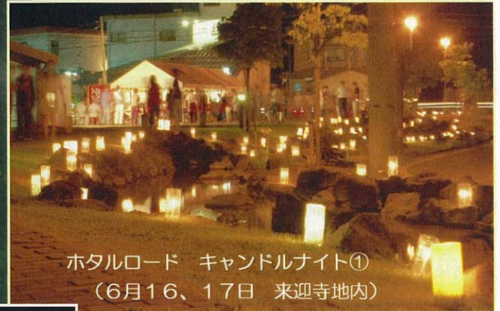
ホタルロード キャンドルナイト① (6月16、17日 来迎寺地内)

今年も「ほたる」の季節になりました。各地区でほたるのイベントが行われました。6月25日(土)の「越路ほたるまつり」は、前日から気温が下がり心配されましたが、当日は雨の中たくさんのホタルが飛び交っていました。ご来場、ご参加いただいた皆様ありがとうございました。