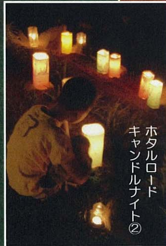
ホタルロード キャンドルナイト②