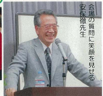
会場の質問に笑顔を見せる 安保徹先生