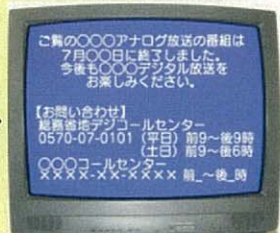
7月1日から 24日正午まで