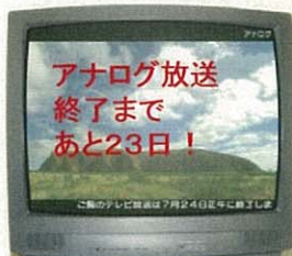
7月24日正午から 深夜まで