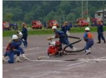
小型ポンプ操法競技会

369名の越路地域消防団員が越路西小学校に集結し、消防演習を実施しました。機械器具点検や、小型ポンプ操法競技会、放水訓練等が行われました。(5月23日)