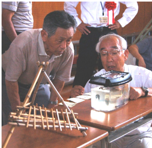
↑会場には洪水防止用の「かまくら」の模型と渋海川に住む生物を展示

飯塚は、江戸時代に稲作の水をめぐっての争いが繰り返された場所です。その飯塚で川と私たちの生活とのつながりを見つめなおすためのシンポジウムが開催されました。来場者からは「もっと子ども達が親しめる川にしたい。」と意見が出るなど会場は熱気に包まれていました。