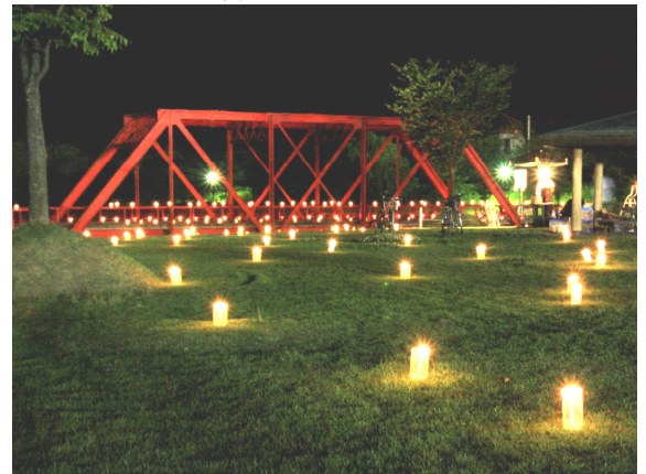
↑ろうそくの灯りで公園をライトアップ