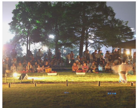
↑民謡や浦上青空子供会による発表の様子