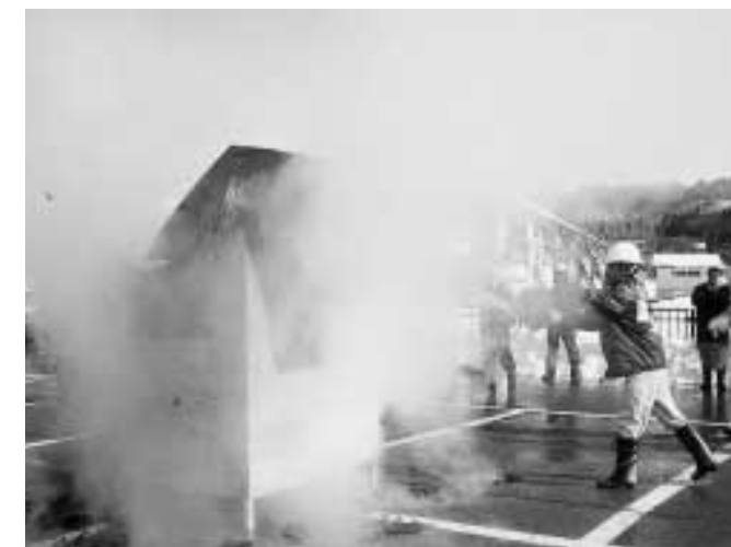
模擬ハウス消火訓練の様子

に気付いた管理人が警報装置を起動、一一九番通報をし開始されました。地元の方々の避難訓練後、長岡市消防署と越路町消防団による放水訓練が行われました。機敏な動作で普通消防車、小型ポンプ車、タンク車、屈折車、そして邸内にある放水銃などを駆使し、表門側、裏門側の両方から放水し消火訓練を行いました。邸内の防火訓練後、長谷川邸の駐車場で一般の方々の参加による屈折車の試乗体験、初期消火訓練、バケツリレーによる模擬ハウスの消火訓練などが次々に行われました。今回の訓練で火災への備えの重要性を再確認しました。