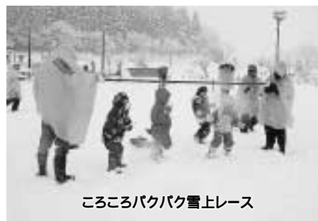
こころこくパクパク雪上レース