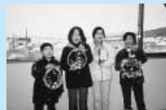
写真は「クリスマスリース作り」の様子です。