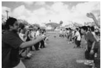
ことばの壁なんて関係ない、交流会

最後に、こんな良い体験をさせていただけただけの方や先生方にお礼を言いたいと思います。ありがとうございました。