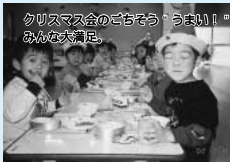
クリスマス会のごちそう“うまい！”みんな大満足。