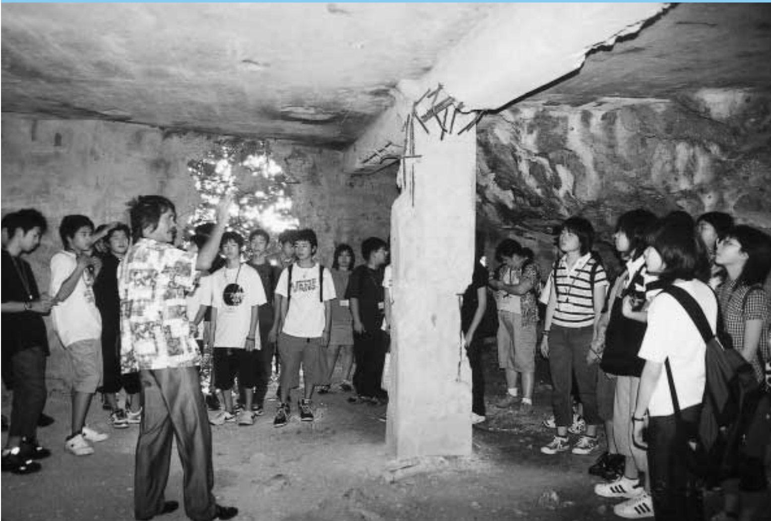
中学生海外派遣事業 12月19日サイパン島 激戦地だった戦跡“ラストコマンドポスト”を訪れて