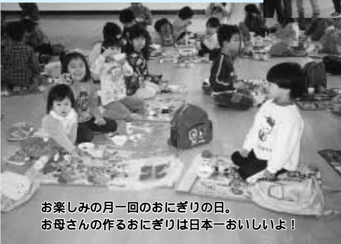
お楽しみの月一回のおにぎりの日。お母さんの作るおにぎりは日本一おいしいよ!