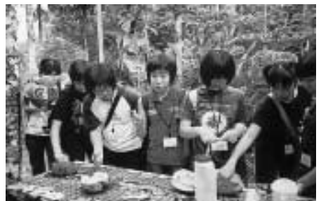
初めて食べる「やしの実」の味は？

後からは買い物に行きました。お菓子やかわいい物がたくさんあってすごくよかったです。お金をまちがってしまったりと不安になったけど、難なく無事に支払うことができました。ほしいものがたくさんありすぎていろいろなところを見ていたらあつという間に予定の時間になってしまいました。そしてとうとう4日目。サイパン旅行最後の日になってしまいました。この日は植物園の見学に行きました。日本では見たことのない変わった植物や色とりどりのきれいな花がたくさんあっておどろきました。また、ヤシの実も食べるのができました。ジュースは今までに飲んだことのない不思議な味がしました。果肉はしょうゆをかけて食べました。おさしみのいかみたくて甘くてとてもおいしくて何個も食べてしまいました。もらいたいです。