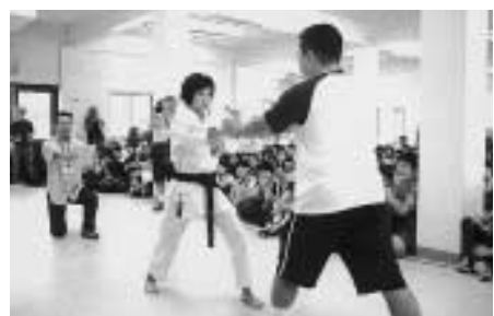
越路町の中学生も踊りや空手の型を披露

12月22日、午前1時47分。私のサイパン旅行が終わった瞬間です。長いようで短かったサイパンでの約4日間はいつもの日本にいた4日間よりずっと楽しい体験ができたと思います。