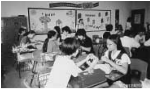
何が入っているか楽しみ！プレゼント交換

たり窓があったりと、当時の情景がありありと蘇るようでした。えんとつのような穴の下では炊事などをしていたのでしょう。ですが、日本軍が米軍に負け、バンザイクリフでたたく人が亡くなってしまったといえます。バンザイクリフには、亡くなった親と子をしのんでか、大きめの像と小さめの像、つまり親子がよりそうようにならんでいるのがとても悲しくなりました。