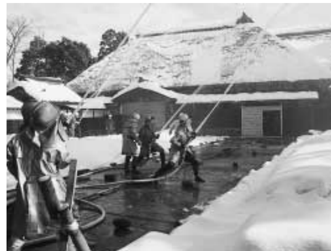
長谷川邸表門側からの放水

一月二十六日は法隆寺金堂壁画が焼損した日(昭和二十四年)にあたるので、この日を「文化財防火デー」と定め、この日を中心として文化財を火災・震災等から守るため、全国的に文化財防火運動を展開している。