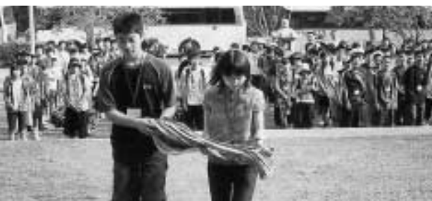
戦没者慰霊碑にみんなで作った千羽鶴を捧げる

待して取り組んでおり、今回で3回目となりました。 参加した生徒たちそれぞれが目的を持ち、サイパン島内を見学、戦没者慰霊碑に献花マウントカール中学校1年生との交流を精力的に取り組み、さまざまなことを感じ取って帰国しました。 参加者の感想文の一部を紹介いたします。(敬称略)