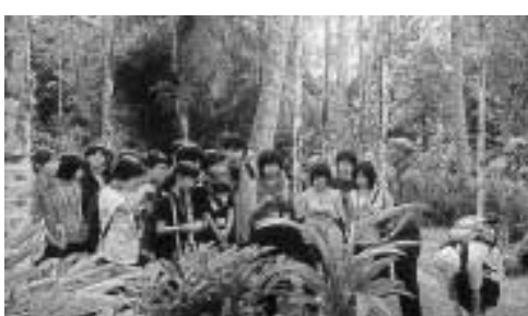
サイパン熱帯植物園で熱帯の世界を満喫

次は、熱帯植物園です。特に印象に残っているのが、ヤシの実とハイビスカスです。ヤシの実のジュースの味は、私はあまり好きではありませんでした。ですが実のほうは、刺し身感覚で食べられ、とてもおいしかったです。ハイビスカスは、赤・ピンクはたくさんみられるのですが、黄・白はとても珍しい