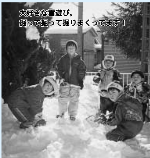
大好きな雪遊び。掘って掘って掘りまくってます!