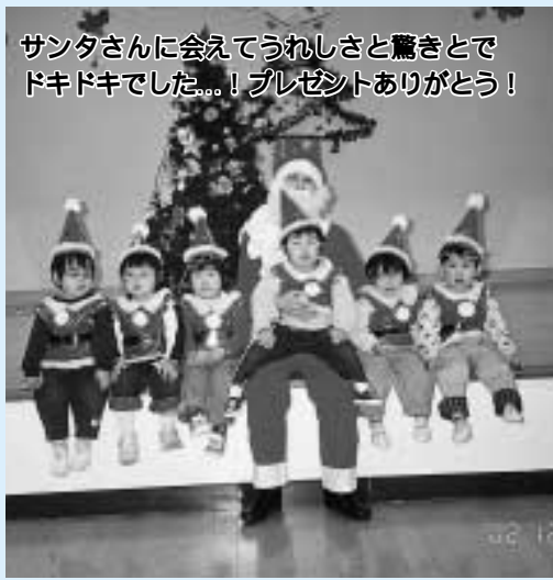
サンタさんに会えてうれしさと驚きとでドキドキでした...!プレゼントありがとう!