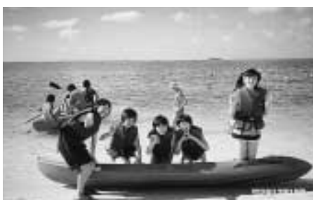
青く澄んだ海で、カヤックに挑戦

12月17日、とうとう待ちに待ったサイパン旅行の日になりました。私は、初めての海外旅行」という期待と不安を胸にサイパンへ向かいました。 1日目はホテルで旅のつかれをとりました。2日目は島内観光と事前訪問と海水浴がありました。ラストコマンドポスト「ヤパンザイクリフ」、「スーサイドクリフ」などのたくさんの名所に行きました。どこも景色がきれいだったのに戦場だったり自殺の場所だったり、信じられない出来事があった場所がたくさんありました。サイパンの海はともきれいで、この海を見ながら飛び降りていってしまつた人達はどんな気持ち