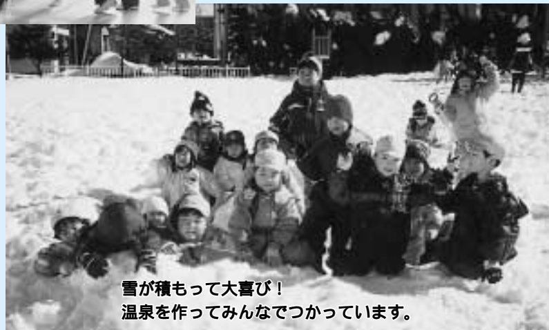
雪が積もって大喜び!温泉を作ってみんなでつかっています。