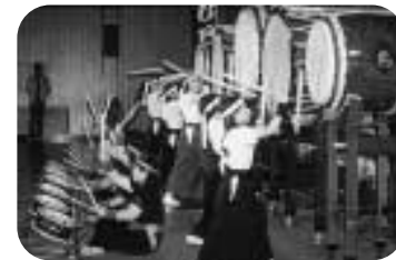
こしじ巴太鼓の勇壮な演奏