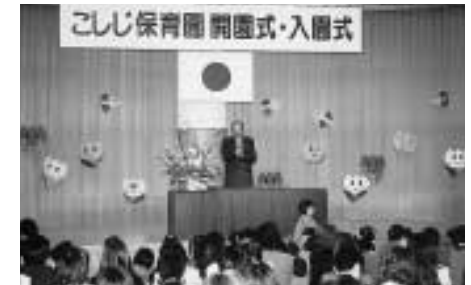
式典であいさつをする大野町長