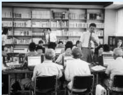
昨年度パソコン教室の様子

5月7日(火)から24日(金)までに、氏名、住所、電話番号、年齢、性別、希望の回、日中又は夜間のいずれかを、お電話にてお申し込みください。越路町教育委員会社会教育係 ☎92-5910 受講料は、無料ですが当日テキスト代として1,000円程度が必要となります。