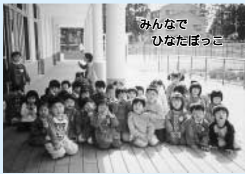
みんなで ひなたぼっこ