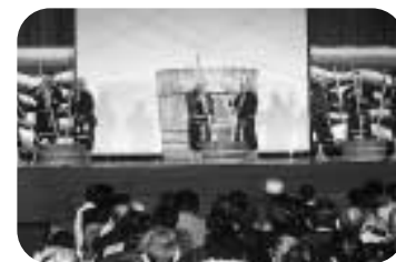
場内に響き渡る酒造り唄