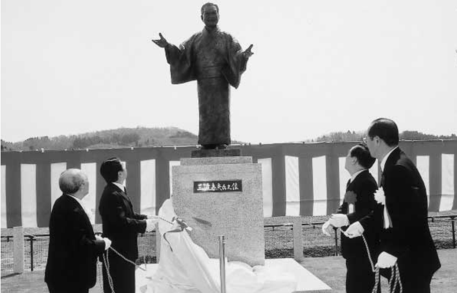
故三波春夫さんの銅像が完成、除幕式が行われました 4月14日塚野山