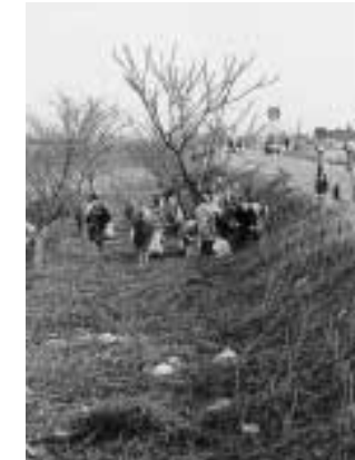
渋海川橋から中沢までの間約2kmの清掃を行いました

4月6日(土)午前7時から町内事業所、団体など約300人の参加により渋海川堤防のクリーン大作戦を行いました。