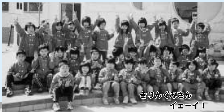
きりんぐみさん イエーイ!