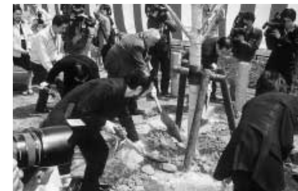
三波春夫さんの辞世の句「逝く空に 桜の花が あれば 佳し」にちなんで銅像の隣に桜の木が植えられました

除幕式後、塚山中学校体育館で、芥川賞作家で新潟市出身の新井満さんの総合プロデュースによる顕彰碑完成記念「越路の春祭り」が行われました。 舞台には、県民文化祭での三波春夫さんのステージで実際に使用された波の幕が張られるなど当時をしのばせる設定がされました。酒造り唄が会場内に響き渡り、「越路の春祭り」の幕が開きました。続いて、三波さんのふるさととの祭り「塚野山灯籠揃い」やこしじ巴太鼓の演奏が披露され、一気に会場内を祭り気分へと誘いました。