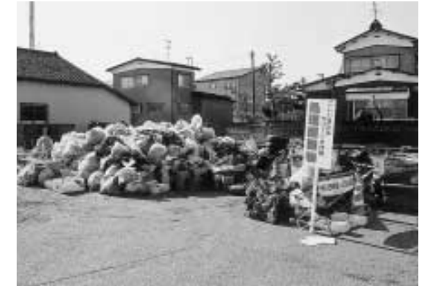
拾い集められたごみの量は約40㎡にもなりました