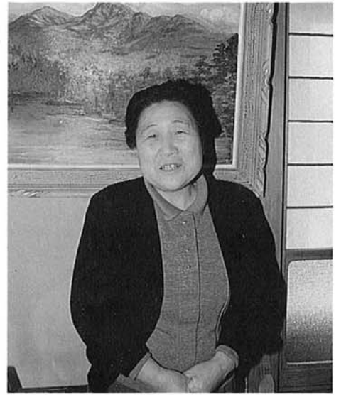
自分で書いた油絵の前で

働きたりの若い時には農作業を一手に引き受け、余暇をとる間もなく働いていました。農業を全部委託してから