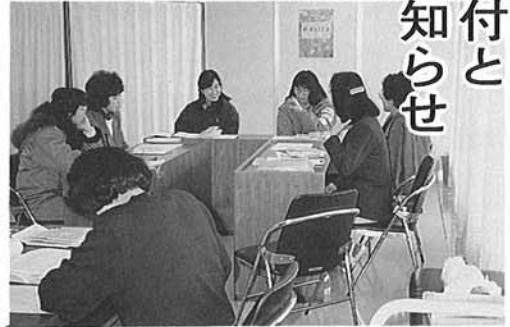
先輩のアドバイスも聞ける母親学級

今年の四月から役場業務の週休二日制が実施されることにより、母子健康手帳の交付を平日受付ことになりました。印鑑を持参で、住民課窓口までおいで下さい。母親学級については、引きつづき偶数月に一回実施いたします。日程については、平成五年度の保健事業カレンダーをご覧ください。母親学級では、育児の悩みや情報を話し合える友だちづくりの場となったり健康づくりの知識を得る場とな