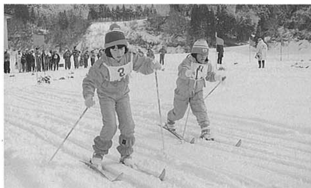
あともう少しでゴール。がんばれ

少雪のため、昨年と同じく距離・リレーの2種目のみとなりましたが、大会参加者200名は友達や家族の声援に励まされ、元気よくコースを滑って行きました。