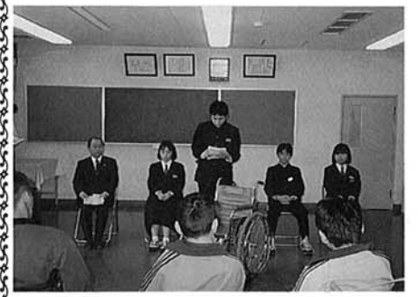
みのわの里へ車椅子を

子どもの交通事故防止 交通ルールとマナーを教え 習慣づけさせるのが 大人の役割 新入学・新入園を迎える子どもたちは、いままで歩いたことのない道を通学路として歩くようになりますし、新学期を控えた子どもたちは、春休みで気分が浮かれがちなころです。このため、子どもの交通事故が毎年この時期に多く発生しています。子どもたちを交通事故から守るために、子どもの特性を知り、正しい交通ルールとマナーを教えましょう。