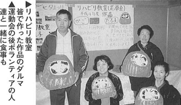
▲リハビリ教室 皆で作った作品のダルマ 運動会の後ボランティアの人達と一緒に食事