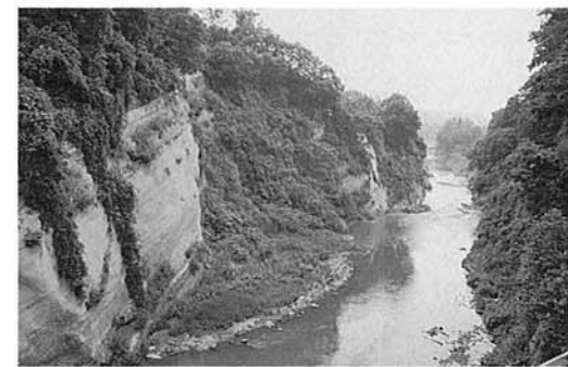
▲200万年前の海成層、塚山層と侵食する澁海川 — JR塚山鉄橋下—