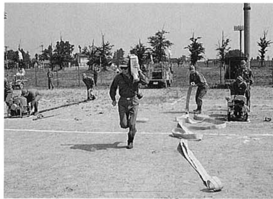
敏速に行われたポンプ操法

六月二十八日(日)信濃川河川公園グラウンドで町総合消防演習が行われました。 この演習は、非常時に備えて消防人として必要な技を身につけ、いざというときに万全な処置ができるよう、また、地域住民の防火思想を高めることを目的に行われました。 午前六時サイレンを合図に町内各地から約五百名近い団員が制服姿もりりしく整然と参集しました。 演習に先立ち、消防協会三島地区支会長並びに長岡警察署長ほか多数の来賓のもと、ラッパ隊吹奏に合せ団旗登壇が行われ、団長訓示、町長あいさつにつづいて無火災分団及び長年消防活動に功労のあった方々に表彰状がわたされました。 引き続きの演習は、三島古志郡連合演習が総数八百人で行われ、通常点検から開始し、自動車ポンプ四台、積載車十三台、手引ポンプ八台及び三島、古志郡の自動車ポンプ二台、積載車六台の機械器具点検が行われた。 ポンプ操法は、地元団員、他町村団員、県大会出場チームの順に、続いて部隊訓練が行われ、息もつかさぬすばやい操作と整然ときびきびした訓練に観客から大きな拍手が送られた。