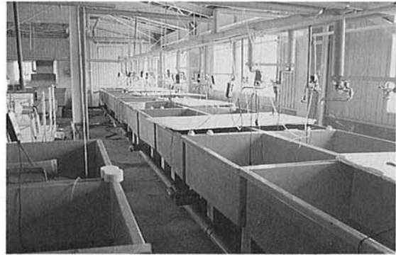
▲どじょうカルチャーセンター室内は産卵、ふ化用の水槽が並ぶ