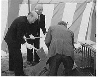
7月9日起工式が行われた