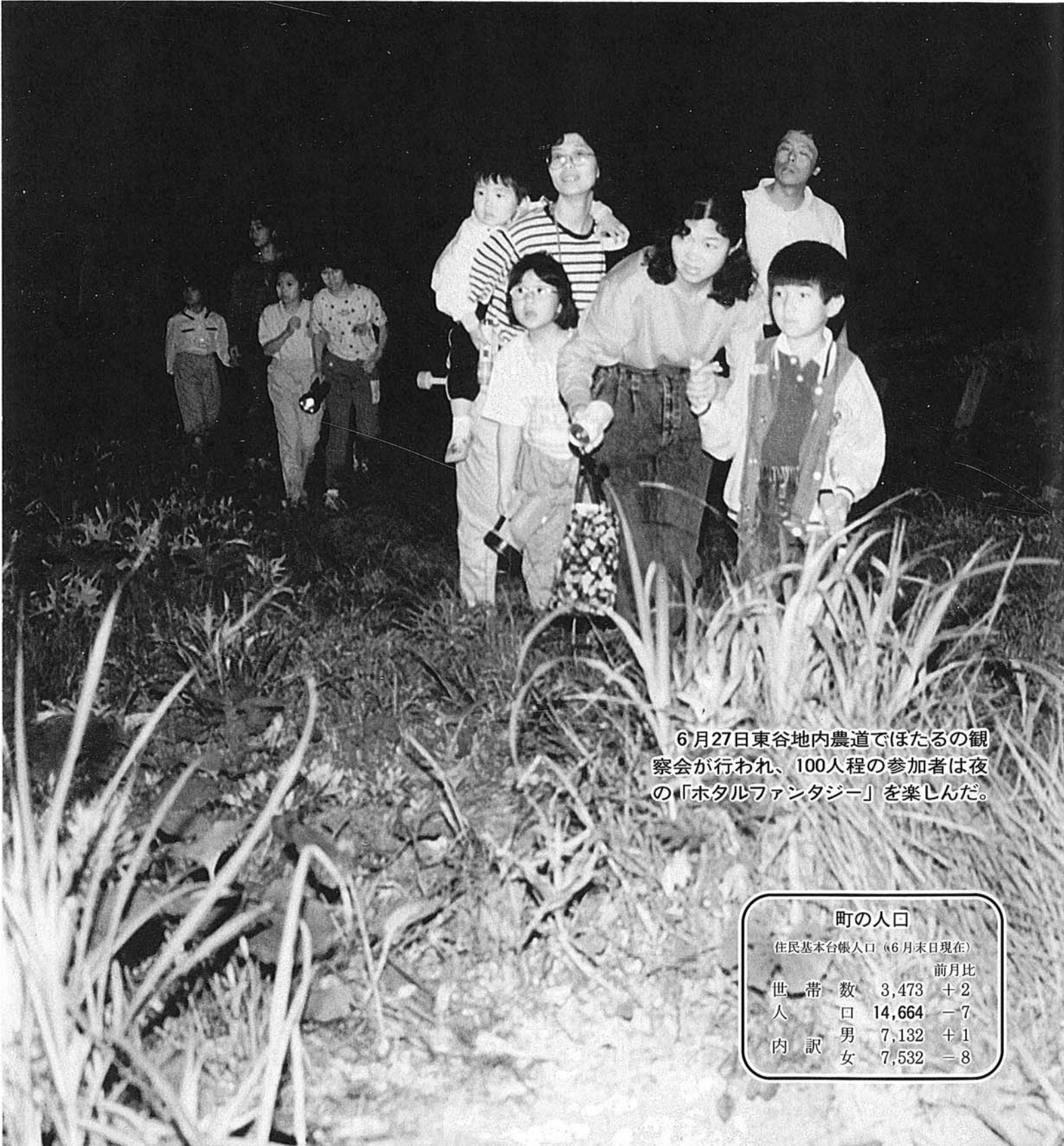
6月27日東谷地内農道でほたるの観察会が行われ、100人程の参加者は夜の「ホタルファンタジー」を楽しんだ。

発行/越路町役場 (新潟県三島郡越路町) TEL (0258) 92-3111 ■ 印刷/大川印刷株式会社