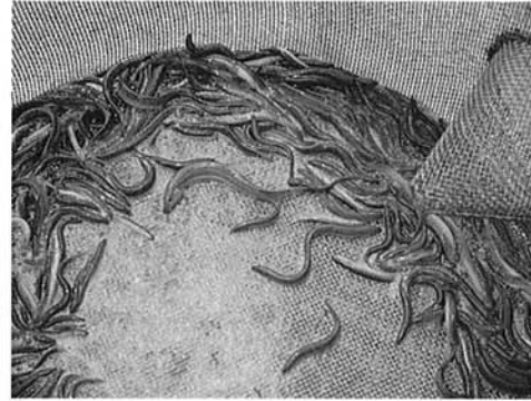
▶捕獲用つっに入った産卵用どじょう