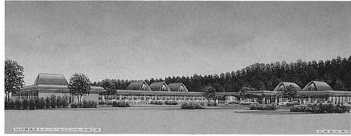
おごしの里完成予想図 平成5年4月より入所予定

平成五年四月に開設予定の「おごしの里」の職員を次のとおり募集します。 ◎募集する職種・人員・資格等 ①事務員：男子及び女子2名 。昭和37年4月2日以降の出生者（30歳未満） 。普通自動車免許所有者 ②生活指導員：男2名 。昭和22年4月2日以降の