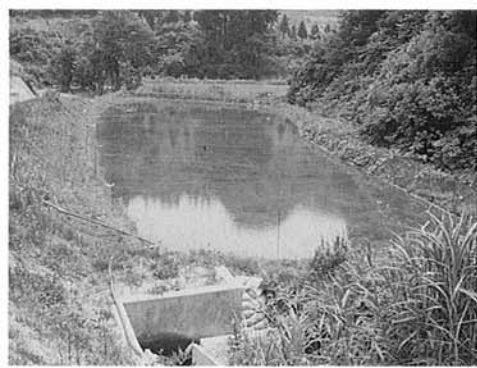
▶菅沼地区の養魚池は団地化が進められている

考えよう 水のあした 水の日(8月1日) 水の週間 (8月1日〜7日) 八月一日は「水の日」。一年のうちで水の需要がもっとも多いこの時期に、水の大切さをもう一度考えてみようと思われたものです。 水の豊富なわが国、かつてはあまりに当たり前すぎて、目を向けることもなかった水が、最近では環境問題などと絡んで国民的な関心事へとクロージアアップされてきました。 とりわけ今の時期、気になるのは飲み水。おいしい水を、とボトル詰め飲料水や浄水器が盛んに売られています。これらはいわば対症療法。天ぷら油を流しに捨てない、洗剤の量は極力減らすなど、日々の生活のなかで、水を守るためにできることに積極的に取り組む姿勢が求められています。その意味では、もっとも水への関心を持つべきなのかもしれません。