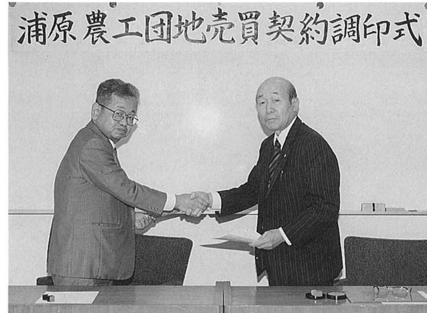
浦原農工団地売買契約調印式