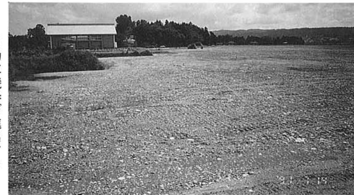
自動車機器が進出する浦工業団地

浦工業団地での工場規模や生産開始時期などはこれから検討に入るが、社員を地元からも採用し町に根をおろした企業に育てたいとしている。 町の企業誘致の大きなねらいは、町民の就業の場を確保することにあり、町内での就業の機会に恵まれ、企業と地元が共に発展することを願っています。