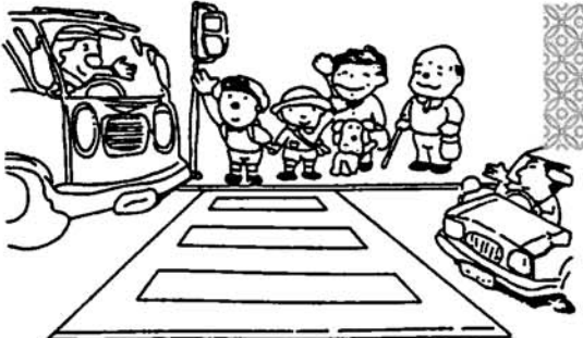
県ぐるみ 大きな輪になれ 交通安全