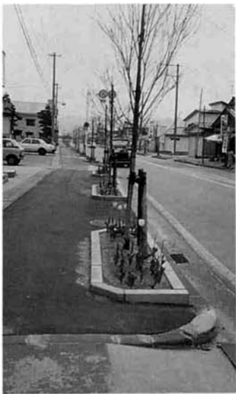
下水道工事のあときれいに整備された歩道

「活かされています」 郵政省の簡易保険・郵便年金に払い込まれる保険料・掛金は、市町村等の公共団体に貸付けされ、地域社会の発展に役立てられています。 当町でも、平成元年度、この融資を受け、道路整備・下水道整備等の事業を実施してまいりました。 道路整備事業では浦地内の町道二〇〇号線の立体交差をはじめとして改良2路線、舗装2路線、消雪施設十九