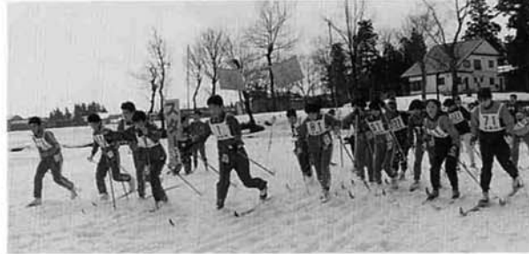
リレー競技の一斉スタート

今大会は回転を除く、距離、リレー、大回転に小学生以上316人の参加があり、大会も大きく盛り上りました。