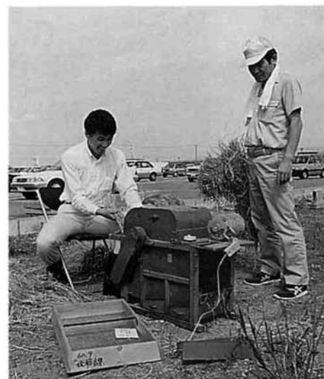
坪刈り稲の脱穀作業