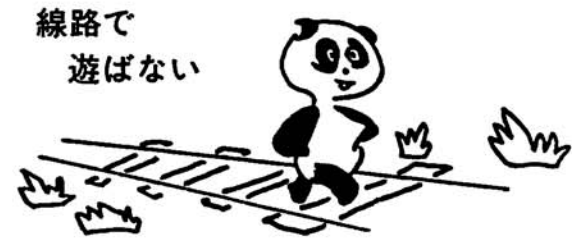
線路立入りは「死」を招く

新潟県司法書士会では、今年度も2月一ヶ月間を「相続登記はお済みですか月間」として無料相談を実施しております。 親がなくなり、土地や家屋などを相続しても登記はつい忘れがちです。相続登記はいつまでにしなければならぬかの定めはありませんが、しかし時間が経過しますと、相続人が経て死亡したりして相続関係が増えたり、又書類の取り揃えやその他で複雑になりがちです。面倒だ、縁 起でもない、費用がかかると思わないで、トラブルを起さないためにも相続登記は早めにするをお勧めいたします。 二月一日から二月二十八日までの一ヶ月間、最寄りの司法書士事務所、相続に関する無料相談をおこなっています。是非お気軽にご相談ください。 詳しくは、新潟県司法書士会へ ☎025・228・1589 相談専用 ☎025・224・6333