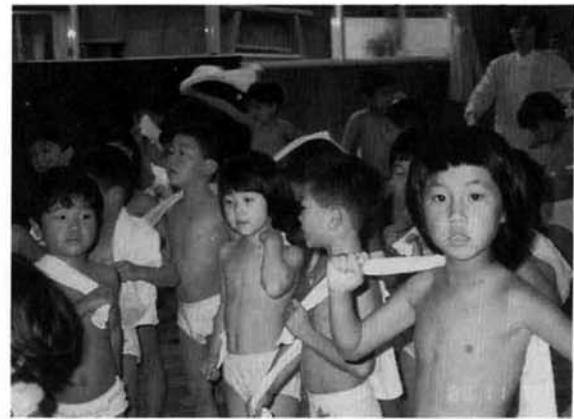
元気に乾布マサツをする保育園児達

「お年寄りのかぜ」 組織細胞の活力が弱っているお年寄りは、ウイルスに対する抵抗力も弱まっています。そのため細菌の二次感染、とくに肺炎に進行しやすくそれに対する予防が何よりも必要となります。お年寄りがかぜをひいたら、まず、症状に十分注意しましょう。もし「こんどのかぜはいつもと違う」と感じたら、一見軽症にみえても大事をとる心がまえが必要です。そして、安静と栄養を考えた消化のよい食事に気を配ってください。