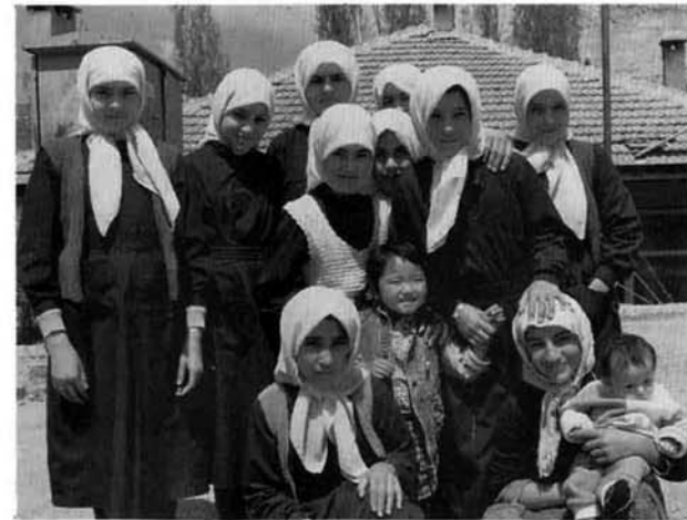
トルコ・アナトリア地方の女子中学生達

ここには、七年前の友人が沢山いてほとんど毎日いれかわり、たちかわり私達の家を訪ねてくれた。お陰で子供達はすっかりトルコ語をマスターしたようです。彼等のほとんどが失業中で定職をもっていない。仕事を求めているのはわずか三人だけでした。それなのに少しも不安をみせないのは冬でも暖かい天候のせいでしょうか。トルコでは、羊の串焼(シシカバウ)を好んで食すが貝やタコは食べないようだ。あの時友人がタコを採ったというので私達家族は友人と六人で無人島へ渡って食べたが、彼等はやはり多くは食べなかった。四月二十四日、もう暑いアンタリアに別れを告げて中部アナトリアからシリアの近くのオスマニエの友人宅へ移った。私達が滞在していた二週間は丁度ラマザン(断食月)の期間で、熱心なイスラム教徒の彼等は四月中旬から一ヶ月間断食を行う。