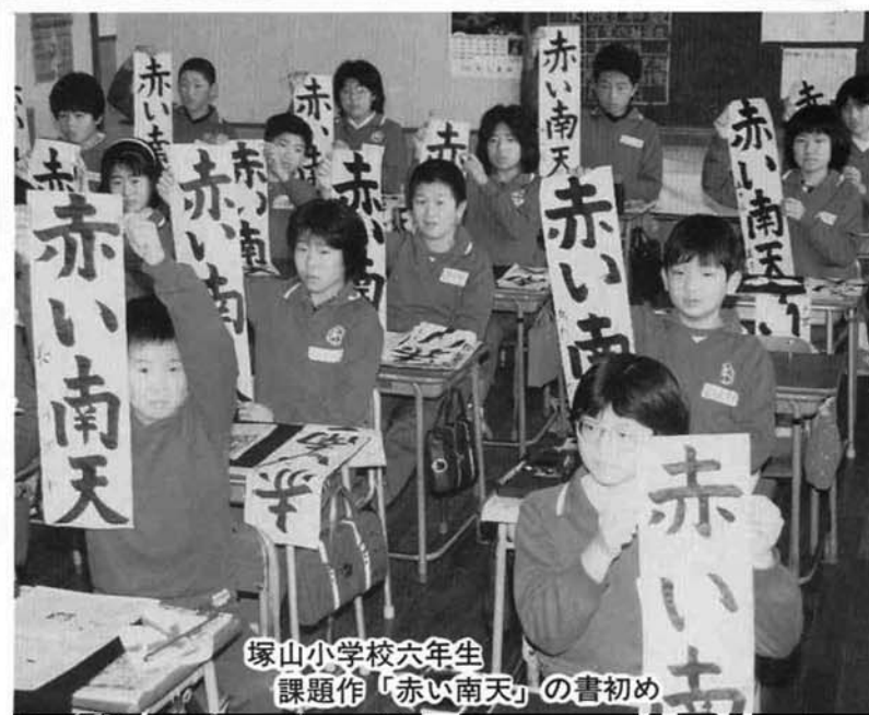
塚山小学校六年生 課題作「赤い南天」の書初め

希望に満ちて命名された「平成元年」は、これから二十一世紀へ向って大きくはばたく君ら若人たちの躍進する時代の幕明けた。