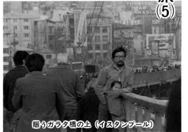
眠るガラタ橋の上(イスタンブール)

トルコはインフレにより物価は高く年々上昇するの、賃金はほとんど変わらないとながら、私達は心からなして、ほんとうにありがたかった。イスタンブールからフェリーでヤロバへ。私達はモロッコでも何度かハマム(風呂屋)へ子供達を連れて行きましたが、トルコのハマムもほとんど同じで、パン