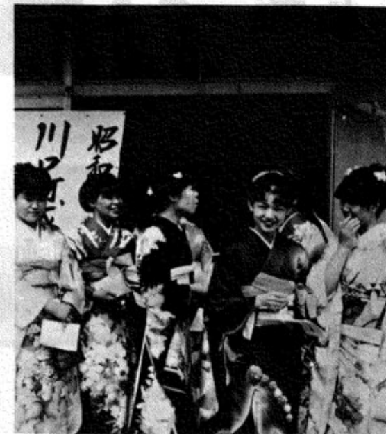
▲ 4月29日 町総合福祉センターにて

町在住、百二十二名の新成人のみなさん、おめでとうございます。「成人式」を節目として、自らに厳しい責任を課せておられることと思います。 「成人」とは、どんな人間を言うのでしょうか。 大きくは三つの面が考えられます。 第一点、経済的独立：親のスネカジリをやめる。 第二点、人間的独立：ふさわしい相手を見つけて、家庭をもつ。 第三点、社会的独立：選挙権が与えられ、国、県、町の主権者として政治に参加する。 現代の青年は、無気力、マイホーム主義である、と多くの意識調査の結果は語っています。また、肉体的には早熟で、社会的には晩熟であるとも……。 この無気力の風潮は「青年に