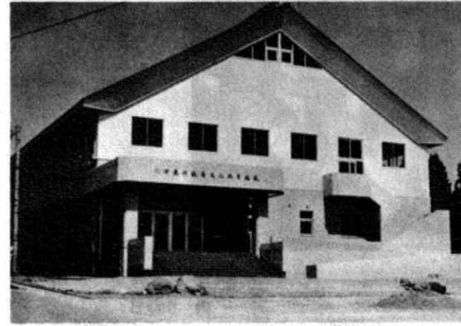
▲このほど完成した「川口体育館」