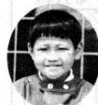
田麦山保育所年長組

田麦山保育所ぶどう組は、今春おにいさんおねえさんになった組。たぶんいつものワンパクぶりを忘れた緊張ぶりでポツリポツリ。1保育所で好きな遊びは?」「ブロック遊び。」「給食にできるもので好きなときらいなものは?」「好きなのはハンバーグ、きらいなのはピーマン。」「お家で最近楽しかったことは?」「おねえさんとぼくとおとうさんとおかあさんで遊園地へ行ってきたとき楽しかった。」「カメラには笑顔で答えてくれました。