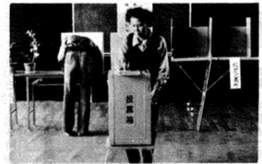
▲ 4月25日 町総合福祉センターにて

県政への方向づけとして、きわめて重要な意義をもつ、新潟県知事選挙がさる四月二十五日執行されました。 当町における投票、及び開票の結果はつきのとおりです。