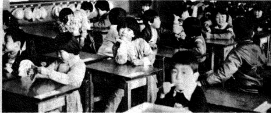
川口小学校 一年生の教室風景