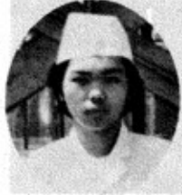
越後製菓川口工場勤務