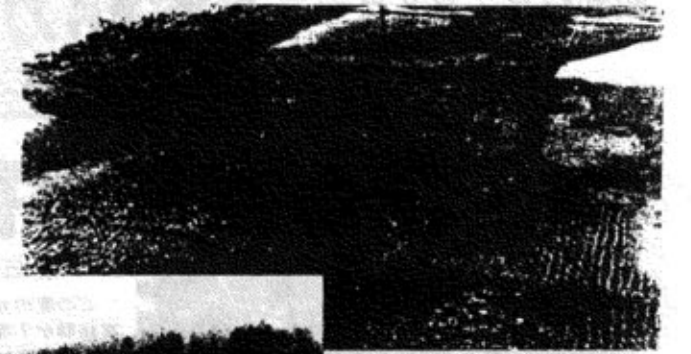
▲土砂をかぶった野田島水田