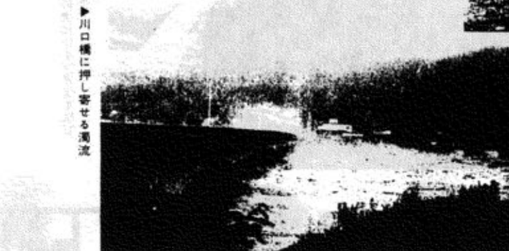
▶川口橋に押し寄せた濁流