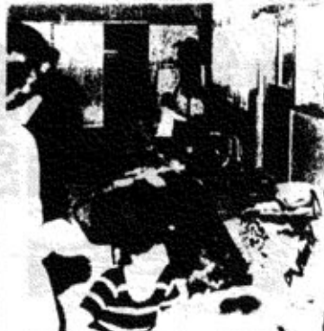
▲旧東部保育所に避難した大島地内の人々