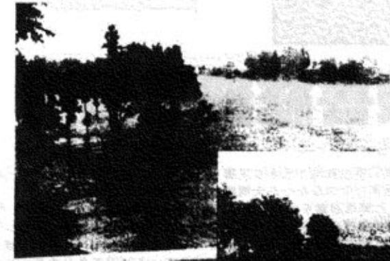
▲和南津橋下流の水田冠水