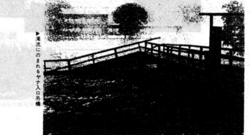
▶濁流にのまれるヤナ入口吊橋