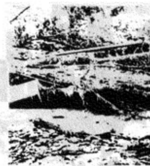
▲河川公園の野球場は後形もなく……