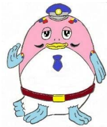
小千谷警察署 マスコットキャラクター 「コイ助君」