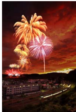
▲ 特別賞「夏の思い出」 外山 満 (弥彦村)