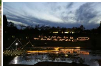
▲ 入選 「10月23日」 中林 愛一郎 (東川口)