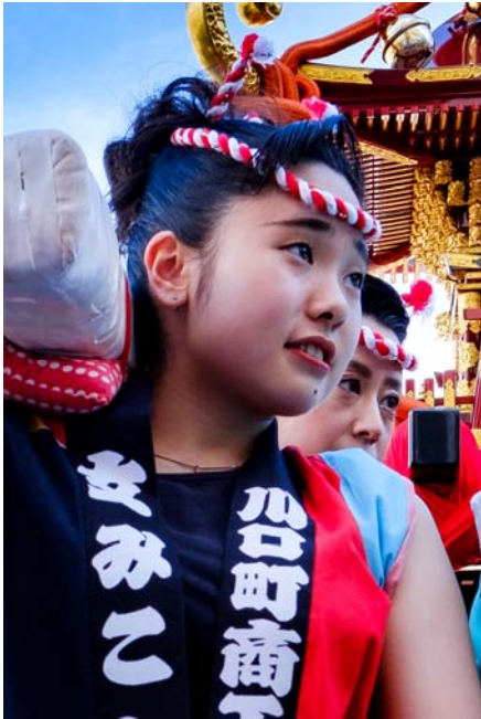
▲ 最優秀賞 「初初しい担ぎ手」 上杉 正春 (新潟市)

11月14日、第21回えちご川口フォトコンテストの審査が行われ、応募総数126点の中から新潟市の上杉正春さん撮影の「初初しい担ぎ手」が最優秀賞に輝きました。おめでとうございます。