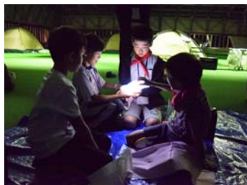
▲ビニール袋でできるランタン作り