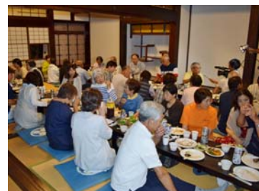
▲古民家でよりあっこ