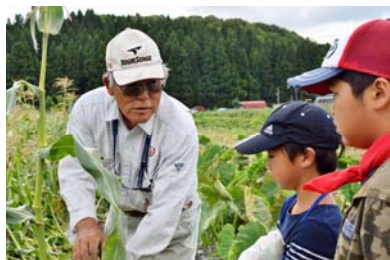
▲川口のおいしい野菜を収穫

9月8日、9日よりあっこが開催されました。狛江市から19人が参加し、川口地域ならではの木沢焼体験や郷土料理作り、そば打ち体験などを楽しみました。夜は、古民家でよりあっこを開催し、おいしい料理を囲みながら和気あいあいと交流を図りました。