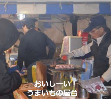
おいしいー！ うまいもの屋台