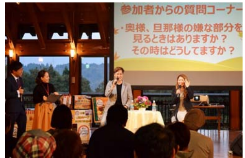
▲ 10月28日 トークショー