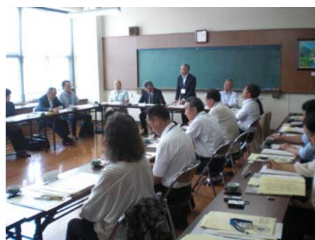
▲ 9月22日 与板支所視察

2年目となる来年度は、統合保育園の整備に関する方向を見極めながら議論を本格化し、年度末までに分科会としての意見をまとめる予定です。