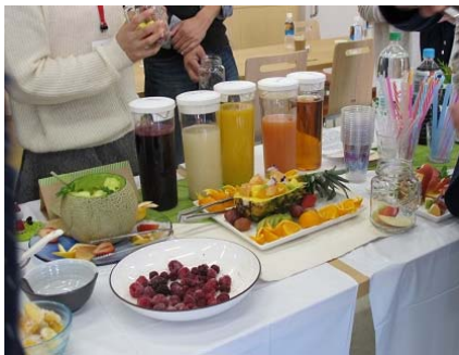
▲ 12月9日 婚活イベント

その他、いずれのイベントにおいても川口地域の特産品や温泉など観光資源のPRにも取り組み「川口地域の良さ」を地域外に積極的に発信することができました。婚活事業は、当分科会で平成27年度から3年かけて実施してきましたが、来年度からは、事業を共に進めてきた地域おこし協力隊が中心となって取り組む予定です。