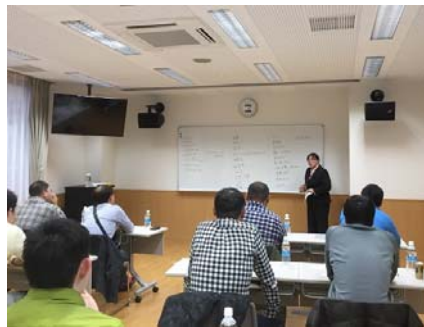
▲ 11月26日 男性事前セミナー