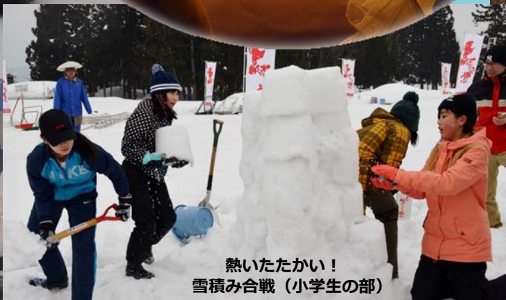
熱いたたかい！ 雪積み合戦（小学生の部）

今年も越後長岡 6 大冬まつりのひとつ「えちごかわぐち雪洞火ぼたる祭」が、2月24日に川口運動公園多目的広場で開催されました。