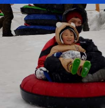
ちびっこに大人気！ ジャンボ滑り台