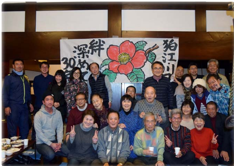
▲ よりあっこ（古民家）

2月24日、「えちごかわぐち雪洞火ぼたる祭」において、ふるさと友好都市である狛江市から、昨年7月に提携30周年を迎えたことを記念して絵手紙で大きく「友」とかたどられた作品が贈呈されました。絵手紙一枚一枚には、川口地域の情景などが描かれ、感謝の想いや変わらぬ友情が続くことを願う気持ちが込められています。夜には、古民家で住民同士の交流会「よりあっこ」が開催され、和気あいあいと楽しく友好の絆を深めました。