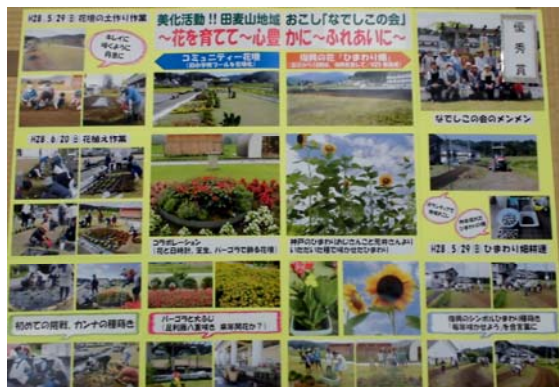
▲ 優秀賞を受賞した「田麦山地域おこしの会」の作品