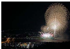
▲ 入選「輝く川口」 入澤 稔夫 (見附市)