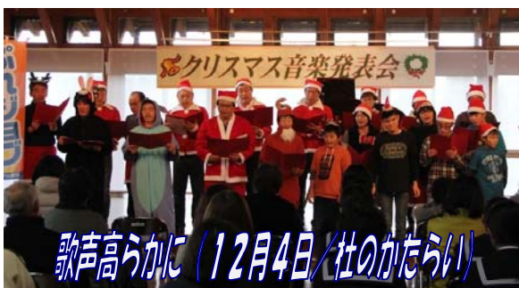
歌声高らかに (12月4日/杜のかたらい)

クリスマス音楽発表会が杜のかたらいで開催されました。ピアノのスペシャルコンサートのほか、吹奏楽やフルート演奏、合唱など総勢12組の皆さんが普段の練習の成果を発表しました。会場に綺麗な音色や歌声が響きました。