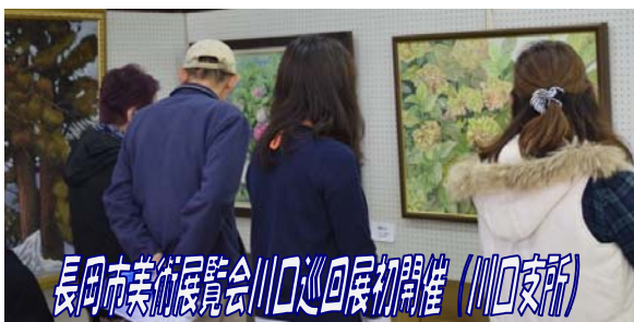
長岡市美術展覧会川口巡回展物開催 (川口支所)

クリスマス音楽発表会が杜のかたらいで開催されました。ピアノのスペシャルコンサートのほか、吹奏楽やフルート演奏、合唱など総勢12組の皆さんが普段の練習の成果を発表しました。会場に綺麗な音色や歌声が響きました。