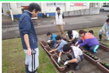
▲ 小学生によるプランターへの定植作業