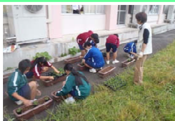
▲ 中学校環境委員会によるプランターへの定植作業