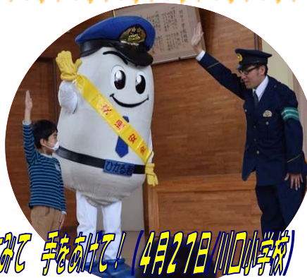
右みて左みてもう1回右みて 手をあけて! (4月27日 川口小学校)