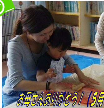
お母さんありがとう! (5月6日/子育ての駅かやくすこやか)