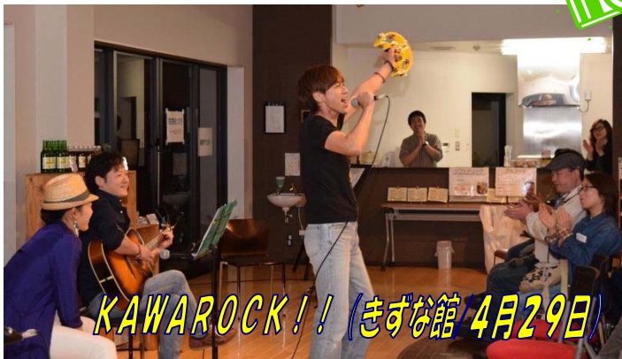
KAWAROCK!! (きずな館 4月29日)

川口のアマチュアバンド達による音楽の祭典がスタート! 想定をはるかに超える総勢160名の皆さんからお越しいただきました。川口小学校の児童が演奏するあおり太鼓やギターの弾き語りなどロックの粋にとらわれない多種多様な曲が演奏され、夜のきずな館が興奮の渦に包まれました。