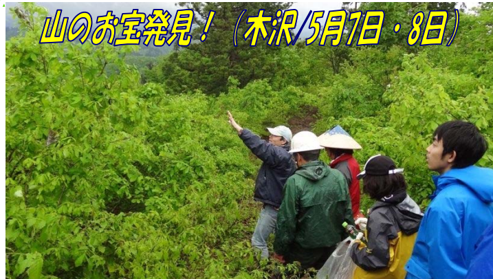
山のお宝発見! (木沢 5月7日・8日)

川口のアマチュアバンド達による音楽の祭典がスタート! 想定をはるかに超える総勢160名の皆さんからお越しいただきました。川口小学校の児童が演奏するあおり太鼓やギターの弾き語りなどロックの粋にとらわれない多種多様な曲が演奏され、夜のきずな館が興奮の渦に包まれました。