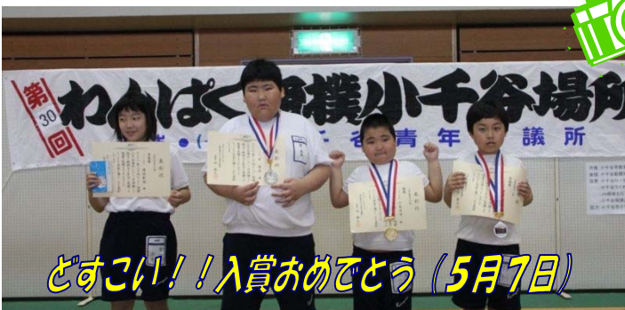
どすこい!! 入賞おめでとう (5月7日)