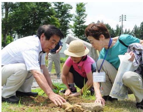
参加者であじさいと北萱浜の皆さんが持参した車輪梅を植樹しました。