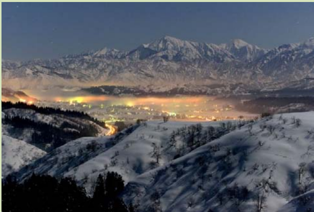
第16回入賞作品 「月光越後三山」