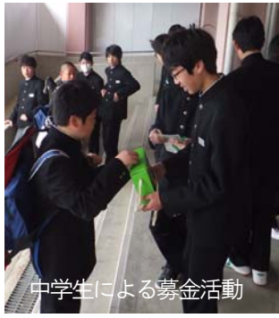
中学生による募金活動