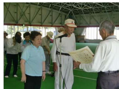
【成績…優勝 田麦山チーム・準優勝 相川Aチーム】