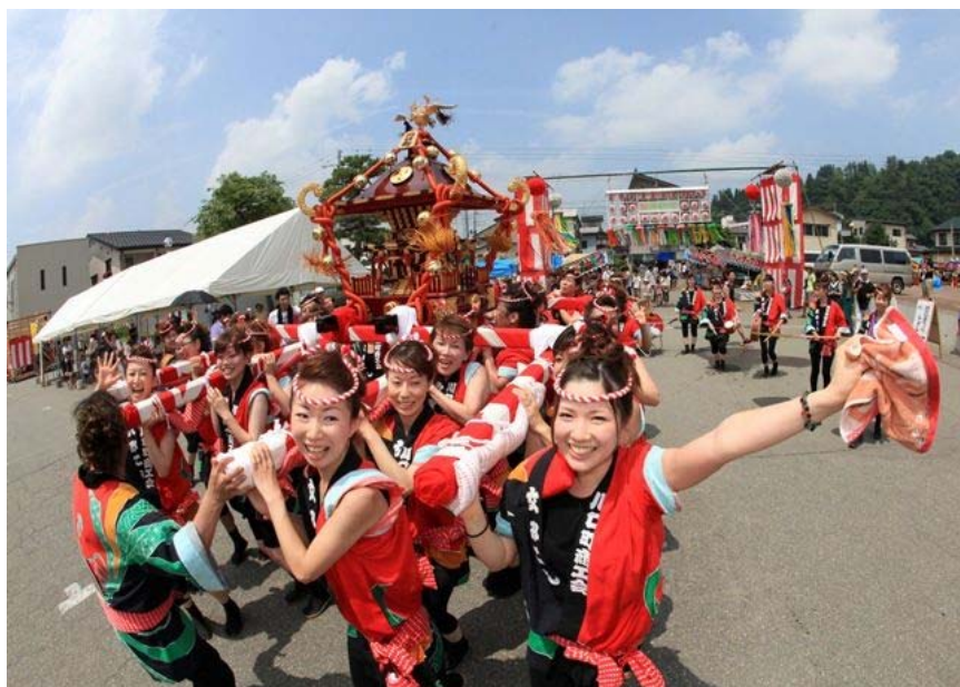
優秀賞・武者行列