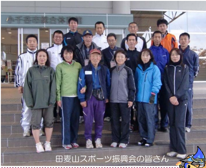
田麦山スポーツ振興会の皆さん