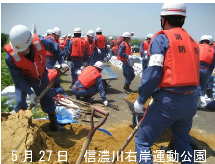
5月27日 信濃川右岸運動公園

また、6月3日には、市民防災公園でポンプ操法競技大会が開催され川口方面隊第4分団が出場、日ごろの練習の成果を見事に披露しました。