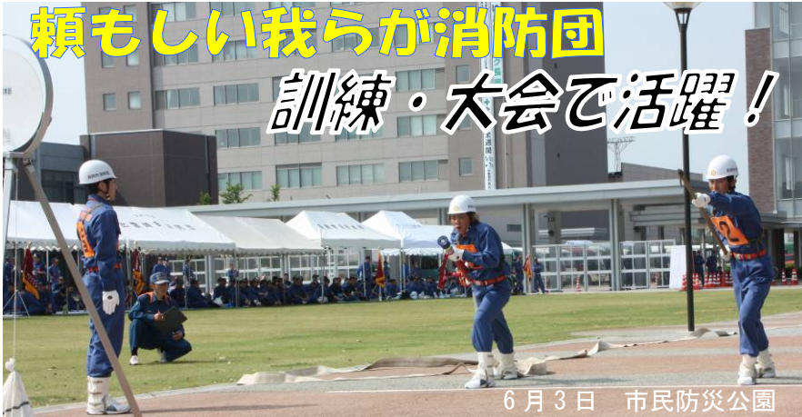
6月3日 市民防災公園