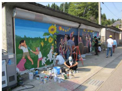
前年度の取組のようす

5月14日、川口支所で開催された第1回川口地域委員会で、今年度の地域コミュニティ事業補助金の事業内容の審査が行われ、2団体が事業採択されました。採択された団体は以下のとおりです。