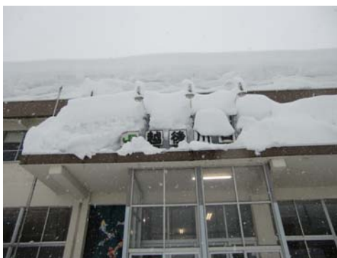
JR 越後 川口駅