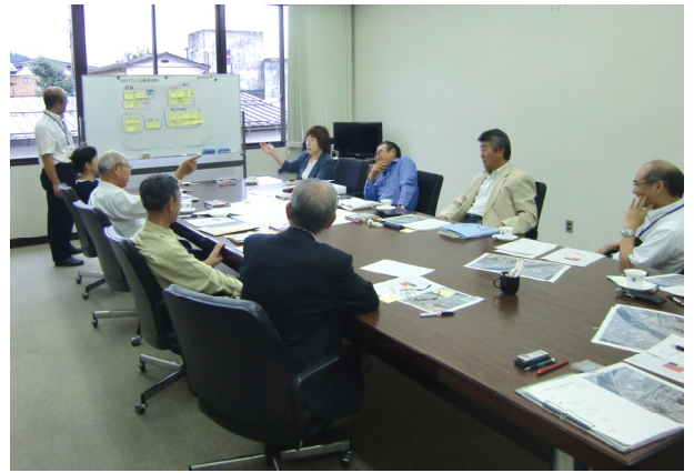
▲熱心に討議する地域委員

今後は、出された意見や要望を踏まえ、実現の可能性や、施設の必要性などを審議し、まとめていく予定です。