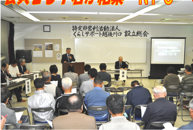
▲川口公民館で開催された設立総会

5月に設立準備会が発足し、6月末から説明会・入会案内が行われ、会員数は231名にのぼり、ついに10月1日にNPO設立総会が開催されました。設立総会では、定款、事業計画、収支予算、会費などについて審議がなされました。今後、認可申請を行う運びとなります。