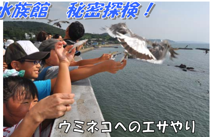
ウミネコへのエサやり

8月10日、川口小学校の児童42名は、無料開放している寺泊水族館を探検。ふだん見ることのできない水族館の裏側を見学しました。そして、ウミネコ(カモメ)への餌やりを初体験。手に持った餌に飛びついて食べていくウミネコに大興奮、貴重な経験をしました。市では、8月26日まで「夏のおでかけキャンペーン」として様々な施設を無料開放しています。川口温泉&プールも、平日の中学生以下のみ無料開放していますので家族そろってお出かけください。