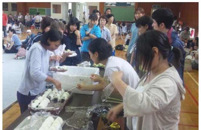
▲ 泉水公民館での炊き出し

被災された皆様に心からお見舞いを申し上げます。市では災害復旧に全力を尽くします。