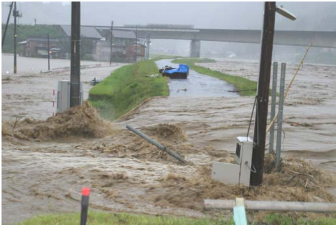
▲ ヤナ場付近溢水状況