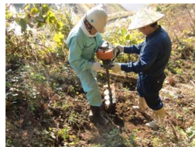
木沢遊歩道階段設置