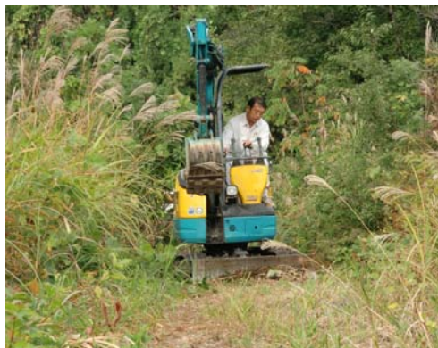
田麦山トレッキングコース亀裂修繕