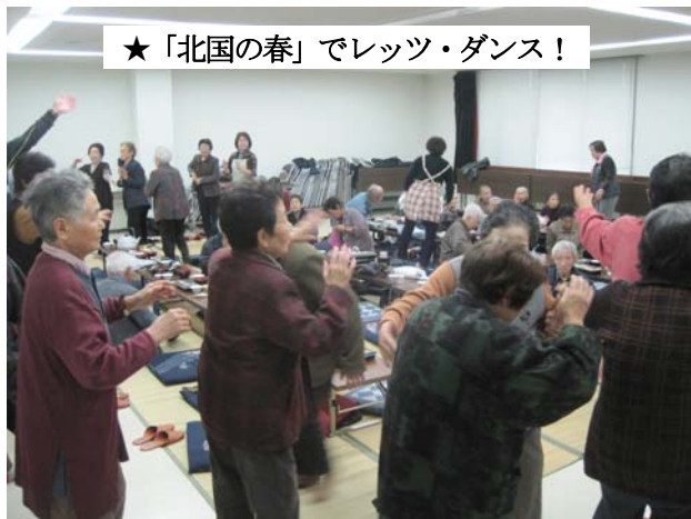
川口地域の世帯数と人口 (前月比較増減) (H22.12.1 現在)

11月23日(火曜日)川口公民館で行われた東川口地区館の東川口地区交流会。参加した老人クラブ会員52名は、地区館特製料理に舌鼓。みんなでカラオケやビンゴゲームなどを楽しみました。