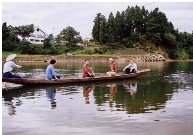
開通した橋の下：渡し舟が交通の手段でした