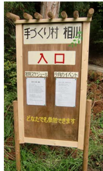
山ノ相川「手作り村相川」看板設置