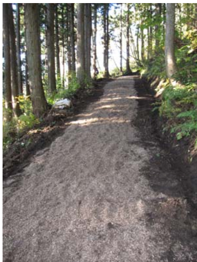
和南津「絆の道」ウッドチップ敷