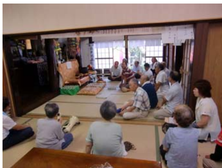
西川口「西倉地藏堂」