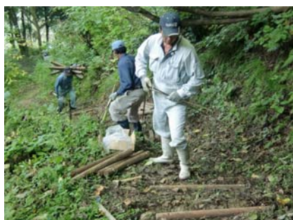
東川口三十三番めぐり階段設置

応募した 5 つの団体は、それぞれの事業の実施規模を実行委員会で話し合っ決定。その後 10 月から 11 月にかけて、里山の整備を行いました。