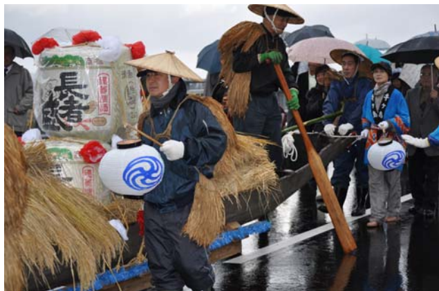
開通の祝い舟を引く地元の人々

11月28日（日曜日）、農免道路牛ヶ島線「牛ヶ島大橋」が完成し、牛ヶ島地区主催の開通式典が行われました。当日はあいにくの天候にもかかわらず地元住民や関係者約250人が完成を祝いました。