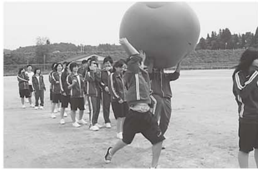
オープニングセレモニーの様子

中学校では、グラウンドの復旧を機会に、オープニングセレモニーを行い、復旧を祝うとともに、体育祭をはじめ、近隣中学校との各種交流試合、更に気軽に参加できる地域のスポーツ活動に幅広く活用していただくこととしていきます。是非、中学校にお出掛けいただき、生徒たちが元気で活動している様子をご覧ください。