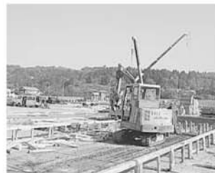
H16年11月8日 仮設住宅建設工事開始