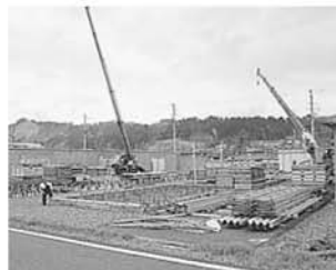
H18年12月5日 仮設住宅解体開始