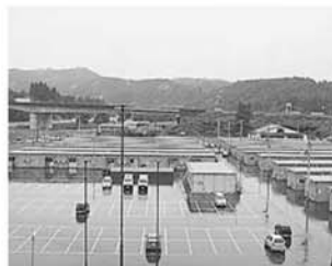
H16年12月2日 仮設住宅入居開始