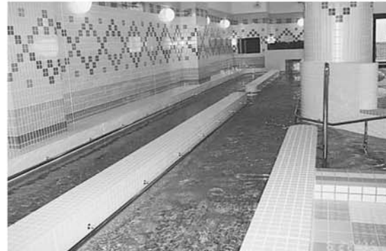
ウォーキングプール 水の流れて逆らって歩くことで高いトレーニング効果があります。