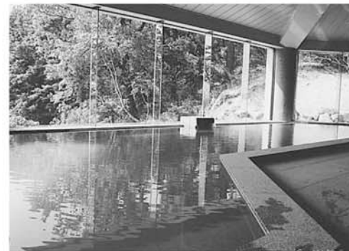
大浴槽 全面ガラス張り眺望を楽しみながら入浴できます。