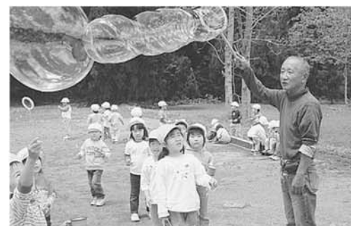
シャボン玉作りのくうりんさんが子どもたちを癒してくれた