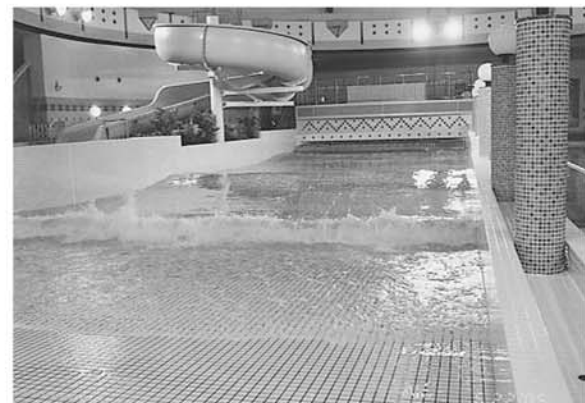
造波プール 押し寄せる波により楽しく健康づくりができます。