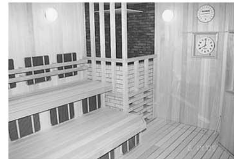
遠赤外線サウナ 高温サウナに遠赤外線ヒーターも備え、高い発汗効果があります。