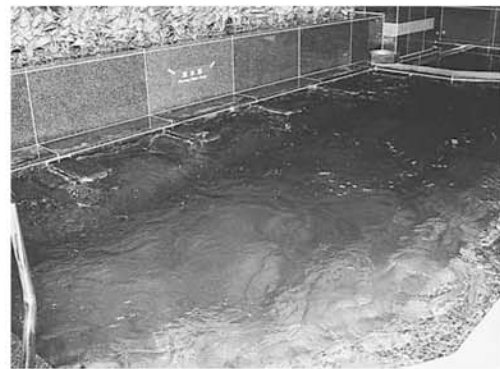
腰掛け式流水浴 流水によるマッサージ効果があります。また腰掛け式で楽な姿勢で入浴できます。