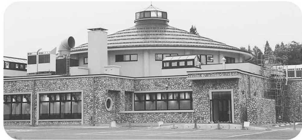
和楽美の湯 温泉・プール棟の外観