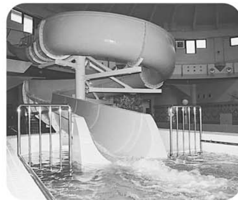
ウォータースライダー 落下高さ約3.7mの本格的スライダーです。

震災の被害により休業していた「和楽美の湯」。平成15年8月から整備を進めていた温泉・プール棟が完成し、本館棟と併せて新たな「和楽美の湯」として、7月23日にオープンします。