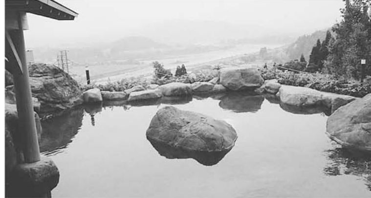
露天風呂 信濃川と魚野川の合流点と河岸段丘が一望できる広々とした岩風呂です。