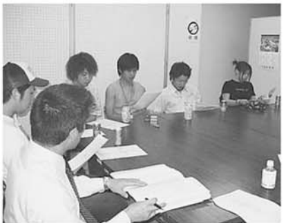
成人の集い準備委員会の様子

みなさん、こんにちは！ 成人式の感想は楽しすぎて何を書けばいいかわからないけど、とにかく全員が無事に成人を迎え多くの人が出席してくれました。やっぱりみんなの楽しそうな顔が一番印象的でした。今、楽しそうな顔ができるのも家族や友だち、先輩、後輩、地域の方など多くの人のおかげです。この感謝の気持ちを忘れず明日からも頑張っていきたいです。