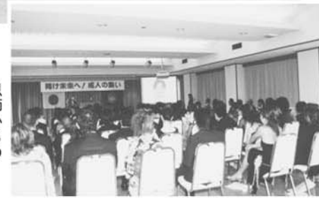
恩師からのビデオレター