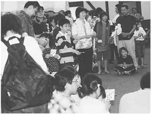
▲ビンゴ大会 もう少しでリーチだ!