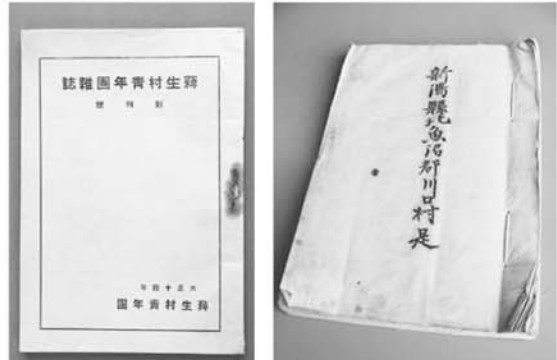
▲村是(大正6年(右)と 蕪生村青年団雑誌(大正14年(左))

竹田の渡辺良さんから町へ資料提供があり、その中大正6年「川口村是」というものがある。今で言えば町勢要覧であるが、統計書のように作られている。ガリ版刷りであるが、地図も印刷されている。 これによると大正5年、川口村は津山、東西川口の人口が3,509人(平成16年4月現在は3,771人)で農業と養蚕の村である。役場は川口と中山境にあり、村長は丸山久一郎であった。村予算は2万円程度である。 新潟県は産業振興のため「村是」を作成して自分たちの村の現状を把握し、振興計画を立てるよう指導していた。 大正時代は第一次世界大戦による大戦景気、都市化、工業化が進む