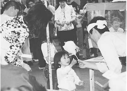
▲わたあめ おいしそう♪

50名以上が参加、数字を発表するごとに歓声のため息が飛び交い、盛り上がりました。