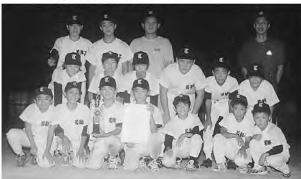
▼優勝「若獅子」の皆さん