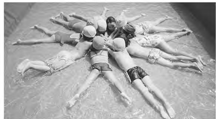
プールの中でひまわりの花を咲かせる子どもたち

焼け付くような暑い・あつい夏。でも子どもたちは、大好きなプール遊びで今年の夏も元氣いっぱいノリノリしました。